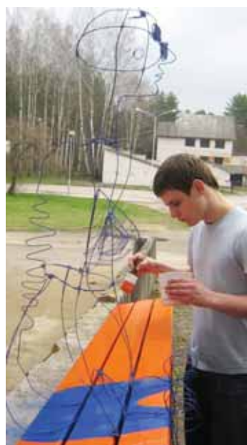
Taip gamintas suoliukas jau stovi M.K. Čiurlionio gatvėje

„Mes tikime, kad žmonių bus, nes druskininkiečiai – lyg viena šeima, mes kartu ir džiaugiamės, ir kuriame, ir padedame vieni kitiems, ir liūdime, ir