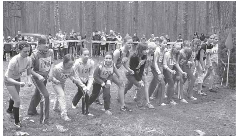
Pavasario krose dalyvavo gausus moksleivių būrys

tokų kvadrato varžybas laimėjo 5a klasės mergaitės ir 5b klasės berniukai. Tradicinį mokytojų ir mokinių tinklinio mačą laimėjo mokytojai. Skaitykloje veikė spaudinių paroda „Kaip tapti sveikesniam“ ir informacinis stendas „Sveika mityba“. Pirmokai žiūrėjo filmą „Sveiki dantys“, o 2 c ir b klasių mokiniai dalyvavo piešinių konkurse „Sveikas gyvenimo būdas“. Penktokai buvo išradingi viktorinoje „Sveikai maitinkimės ir daug judėkime“. Tik puse balo nugalėjo 5 d klasė. Penktadienį mokyklos valgyklos darbuotojos paruošė įspūdingą ir gausų sveiko maisto stalą.