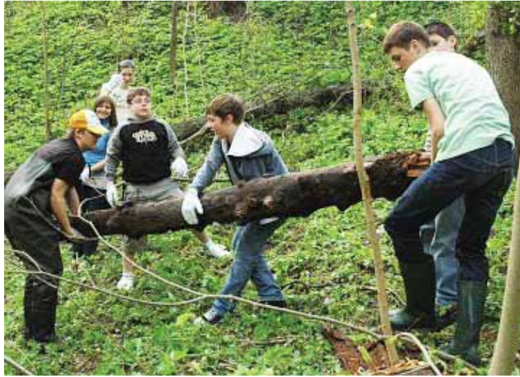
Jaunimas tvarko upelio pakrantę

tėje skambanti muzika, bet ir puikus oras, privertęs visus pasiraitoti rankoves. Veikti ką tikrai buvo nemažai. Druskininkų komunalinio ūkio darbuotojai jau nuo ryto genėjo medžių šakas bei vešlius krūmokšnius, kuriuos reikėjo sunešioti į krūvas, vėliau krauti į mašinas išvežimui, taip pat, žinoma, rinkti šiukšles. Nemenkas būrys jaunimo ir, džiugu, ne vienas vyresnio amžiaus druskininkietis dirbo nepailsdami. Keli drašuliai, avėdami žvejų batais, brido į Ratnyčėlės upelį ir atsakingai iš ten išrinko šiukšles bei šakas. Visi dirbo vieninai, tikslo link judėjo besišypsodami ir gerai leisdami laiką, tuo