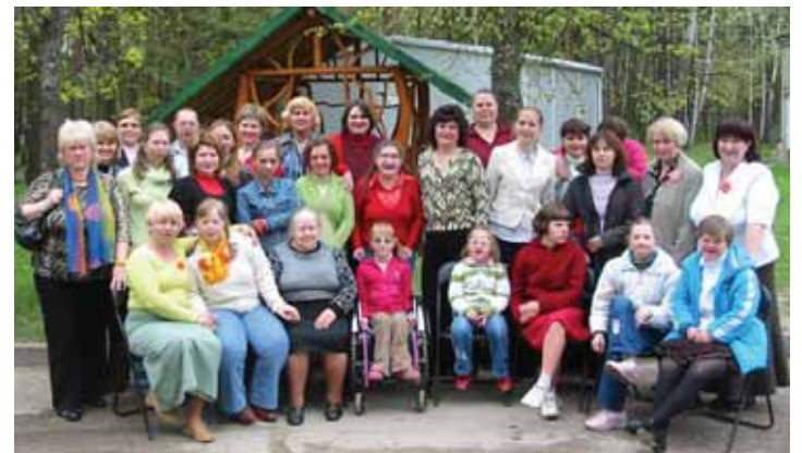
Bendrijos „Druskininkų viltis“ nariai kelionės metu

Kreipiuosi į visus Druskininkuose gyvenančius sutrikusios raidos asmenis, jų šeimos narius ir kviečiu aktyviai dalyvauti Šeimos paramos centro veikloje. Galite mums paskambinti tel. 51844 arba atvykti adresu: Veisiejų 17, kasdien nuo 9 iki 17 val. Lauksime jūsų.