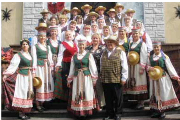
Druskininkiečiai saviveiklininkai prie Lenkijos gynybos akademijos klubo salės, kur koncertavo