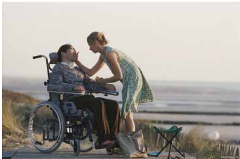
Kadras iš filmo "Skafandras ir drugelis"