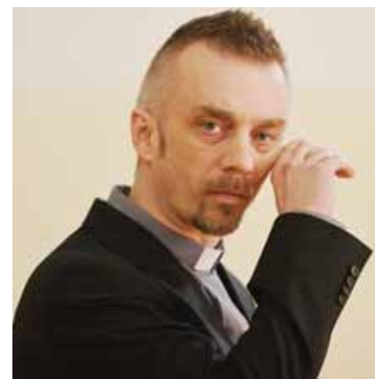
Andrius Mamontovas irgi atvyks į Druskininkus

Druskininkų teatro festivalio informacija