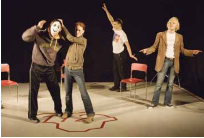
Iš spektaklio „Poliklinika“

Šeštadienį pamatysime šokio spektaklį „8 kvadratiniai metrai“, kuris tapo savotišku Gyčio Ivanausko teatro manifestu. Pasak kritikų, tai - ryškus šiuolaikinio spektaklio pavyzdys. Jame daug užuomi-