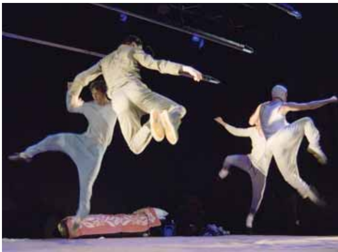
Šokio spektaklis „8 kvadratiniai metrai“

nu: čia ir sekso „pramonė“, ir bergždžias TV spoksojimas, ir bejausmis šokis dėl šokio. Gerą humoro dozė pinasi su rimtimi: žmonės čia laksto, guli, treniruojasi, plauna kojas, kažką žiūri, puošia alijošių kalėdiniais žaislais ir vėl šoka, kol šokis tampa jų gyvenimo būdu.