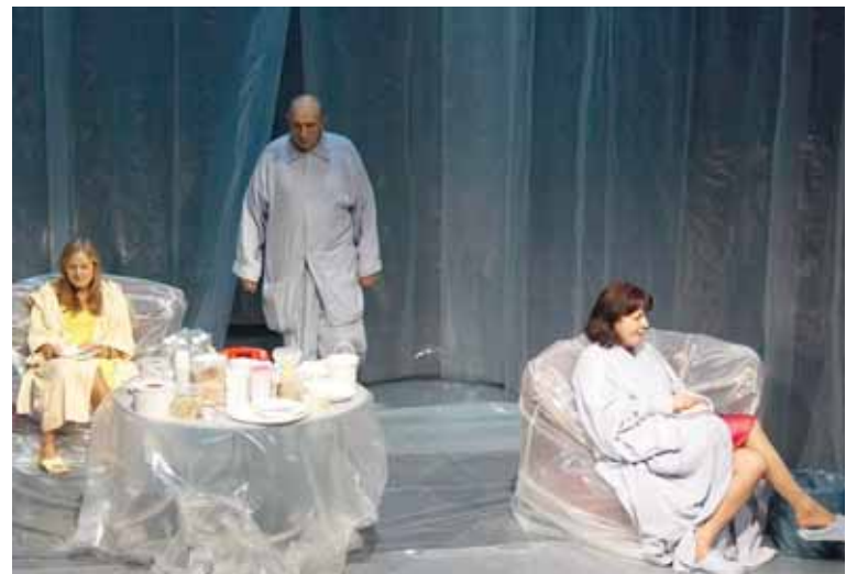
Iš spektaklio „Laukim skambučio“

atro spektaklį „Laukim skambučio“. V.Masalskio spektaklyje juokiesi, tačiau jauti kažką nemaloniai grėsmingo ir atpažįstamo. Spektaklio centre – šeimos laštelė. Moteris kalba, vyras pritaria, vaikas tyli – tokia šios šeimos „politika“. Visa trijulė vilki chalatais, motina ir tėvas – bjauriai nuskalbtais ir nudėvėtais. Tokie pat nudėvėti ir jų veidai, jausmai ir santykiai. Jie laukia vaikiną, kuris turi įvesti antrą telefono liniją namuose. Tai primenama tarpuose tarp trumpų pokalbių, aistringų barnių ir nuolatinių priekaištų. Juokingi, taiklūs dialogai aktorių lūpose virsta absurdo deimantukais. Tačiau juokdamasis sykiu šurpsti nuo to, kokios piktos ir atpažįstamos tos nesibaigiančios pašaipos, apmaudo, puolimo ir gni-