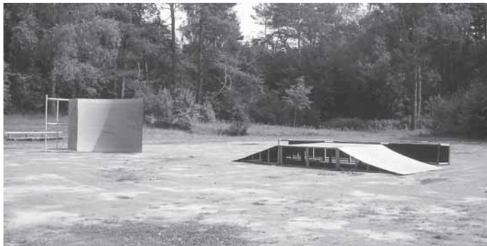
Riedučių ir riedlenčių rampos, netvarkingai sumestos parke

Vidutinio medinio riedučių parko įrengimas be dangos (asfalto) kainuoja nuo 75 iki 200 tūkst. litų, todėl žmonių, kurie rėmė šią statybą, pinigai buvo išmesti, nes savivaldybė šiam parkui skyrė tik kelis tūkstančius litų. Girdėjome gandus, kad savivaldybė pažadėjo ir naują aikštelę, ir daugiau bei geresnių rampų. Pareigūnai dažnai tik žadėti moka. Kažin, ar jie skirs kelis milijonus asfaltavimui ir kelis šimtus tūkstančių rampoms?