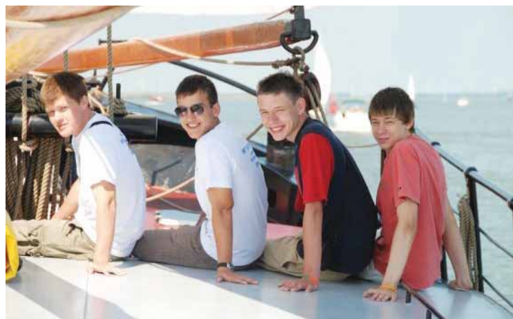
Mūsų vaikinai jachtoje