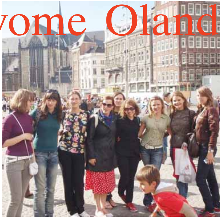
Druskininkietės stovyklautojos Amsterdame

Antradienį druskininkiečių delegacijos programa buvo visiškai kitokia nei likusių stovyklos