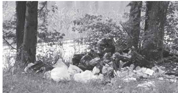
Kartais po savaitgalio Avirio pakrantėse lieka krūvos šiukšlių