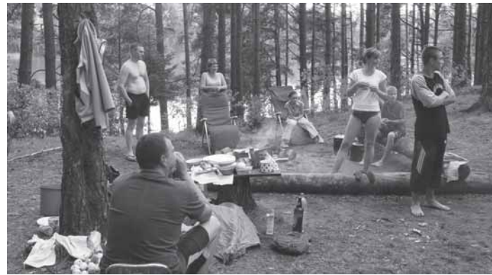
Stovyklautojai nustebo sužinoję, jog įsikurti, kur papuola - negalima

Bėda ta, jog daugelis nė nenutuokia, kad yra tokios Miško lankymo taisyklės, kuriose juodu ant balto surašyta, ką galima ir ko negalima daryti miške. Posakiu, kad gamta – visų namai, šiais laikais nepasiteisinsi, kaip ir dievogojimusi, jog nieko apie tai nežinotum. Tos taisyklės nurodo, kad automobilio negalima pastatyti ant miško paklotės, žolės ar tiesiog uogienojuose. Mašinos gali stovėti tik specialiai tam skirtose vietose arba ant keliuko. Taip pat automobilio negalima palikti arčiau nei 25 metrai iki vandens telkinio. Palapinės irgi nevalia susitverti ar laužo susikurti bet