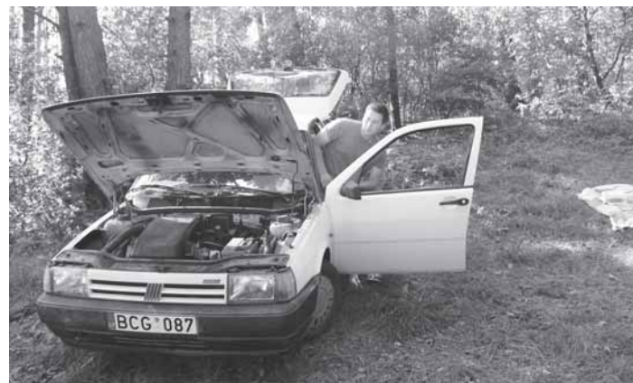
Palikto ant žolės automobilio savininkas turėjo sumokėti baudą

kurioje patikusioje vietoje – įsikurti galima tik specialiai įrengtose, įteisintose poilsia vietėse. Prie Avirio tokių yra keturios – su įrengtomis laužavietėmis, šiukšliadėžėmis, tualetais ir aikštelėmis mašinoms. Pavyzdžiui, populiariausioje geltono smėlio poilsia vietėje Veršių kaime yra tikrai pakankamai vietos statyti palapinėms – šios teritorijos ribas žymi miške iškastas griovys.