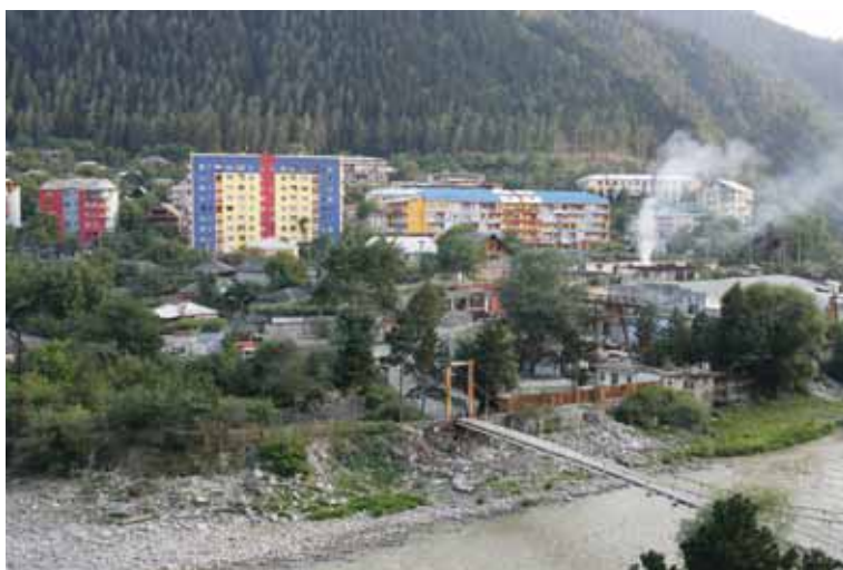
Boržomio kurorto panorama

Š į savaitgalį Druskininkų teatro festivalyje pamatysime dvi absoliučiai skirtingas, tačiau žiūrovus smagiai kvatoti privertusias lietuvių dramaturgų Mariaus Ivaškevičiaus ir Sigito Parulskio pjeses. Taip pat "Eglės" sanatorijos salėje atidroma fotografijų paroda, kviečianti susipažinti su įvairove ir grožiu alsuojančiais Gruzijos gamtovaizdžiais bei jos miestelio Boržomio realybe. Iki pat festivalio pabaigos bus renkamos aukos šio kurorto gyventojams.