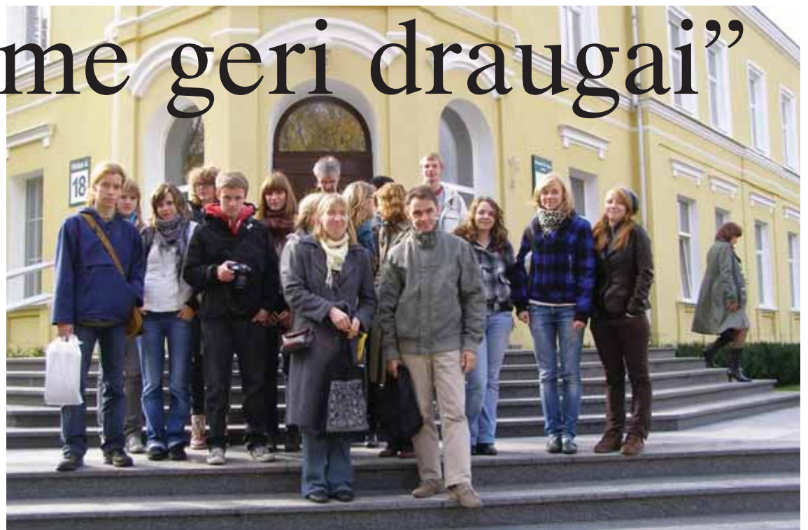
Projekto dalyviai prie kurorto savivaldybės

V.S. Buvusiuose projektuose susitikimuose teko gyventi ir šeimose, ir viešbučiuose. Moksleiviai taip susidraugavo, kad būdavo gaila išsi-