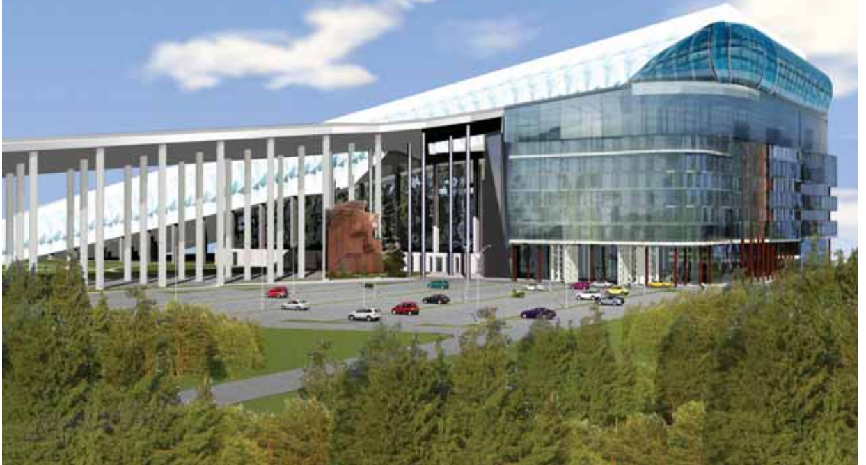
Taip Druskininkų slidinėjimo trasos projektuotojų vizijose turėtų atrodyti išorėje ir viduje (žr. pav. apačioje)

D ėl būsimų Druskininkų slidinėjimo trasų – geros naujienos. Ūkio ministras spalio 27-ąją pasirašė įsakymą įtraukti mūsų kurorto uždarytų kalnų slidinėjimo trasų su dirbtine sniego danga įrengimą į valstybės planuojamų finansuoti turizmo objektų sąrašą.