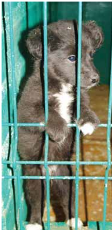
Gal tu norėtum būti mano šeimnininkas?

Labai jauni apsigyvenę kartu, Vladas su Deimante turėjo sugalvoti, kaip prasimanyti pinigų. Nusprendė užsiimti tuo, kas ar-