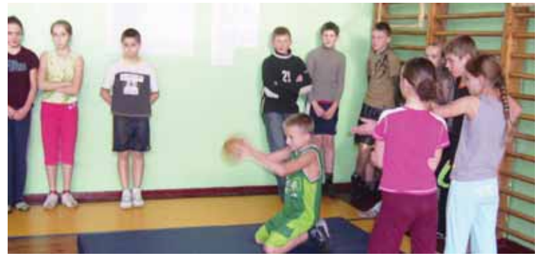
“Atgimimo“ vid. mokyklos moksleivis kimštinio kamuolio metimo klūpant rungtyje