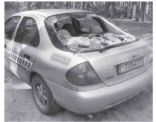
Rugsėjo 24 d. naktį buvo išdaužyti dviejų „Markizo“ įmonei priklausančių taksų automobilių Ford Mondeo, stovėjusio Liškiavos gatvėje, ir MB, stovėjusio prie Veisiejų g. 22 namo, langų stiklai

bo, – sako įmonės savininkė. – Negi savi darbuotojai ims ir patys sau nepagrįstai kenks? Be to, mūsų taksistus itin dažnai klaidina ir netikri taksų iškvietimai”.