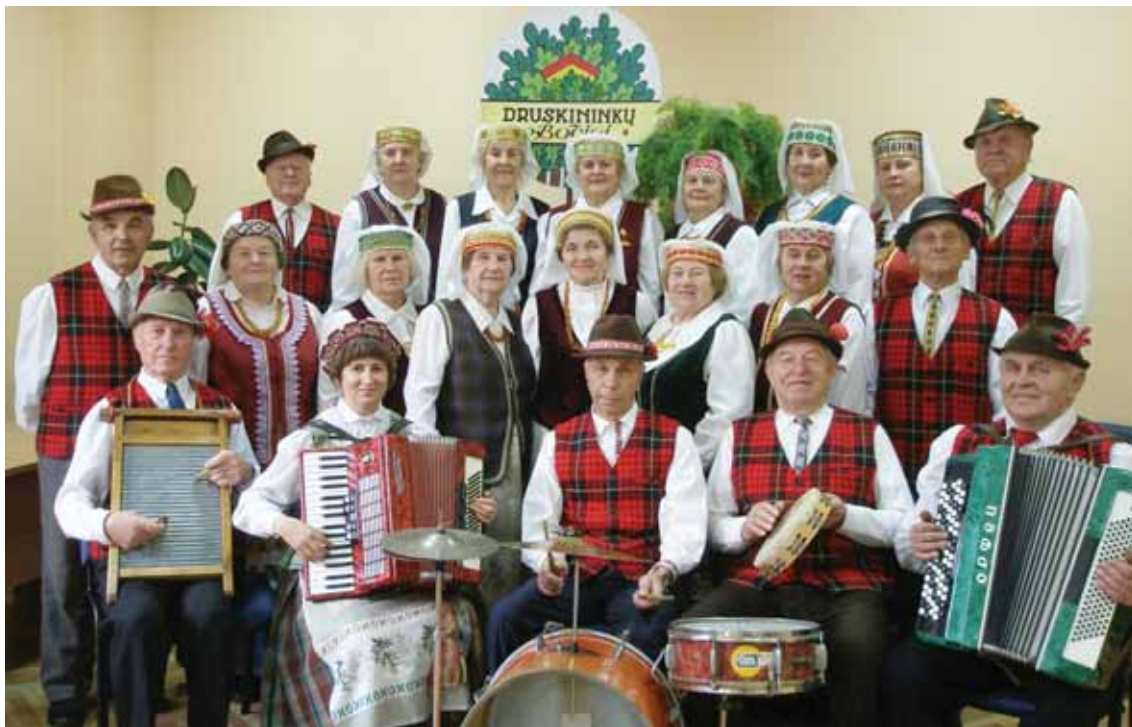
Druskininkų “Bočių” ansamblis

Gera mums priimti svečius tokiuose nuostabiuose rūmuose