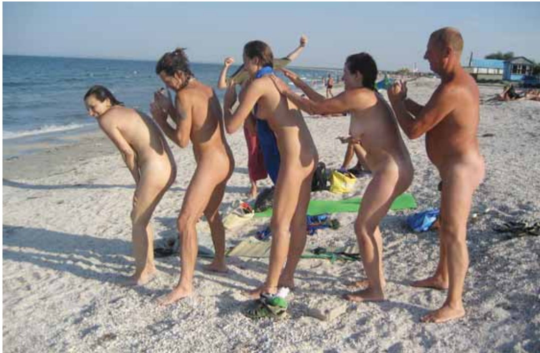
Jogos kursų dalyviai, nuogi susilieję su gamta, patyrė dvasinę palaimą