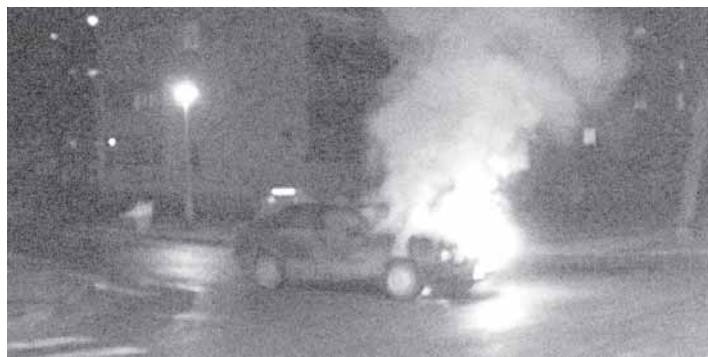
Degantis automobilis gruodžio 24 d. Ateities g.

G ruodžio 4-osios vakaras Ateities gatvės sankirtoje, šalia "Samsono" parduotuvės, buvo ištis neramus. "Kažkas čia tokio antgamtiško, - kraipė galvas trijų įvykių liudininkai. – Arba vieta yra nelaiminga, arba koks nors juodulys įsisuko".