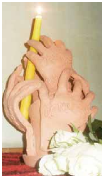
Vaikų sukurtas Leipalingio simbolis

mams mokytis. Galiausiai projektas pristatytas mokyklos ir miestelio bendruomenėms. Vaikai ne tik pasakojo, bet ir suvaidino pasaką „Ropė“, dainavo, žaidė. Projekto metu sukurtą simbolį Leipalingiui perdavė seniūnijos atstovams, kad jis primintų, jog gimtojo krašto ateitis – gabių vaikų rankose.