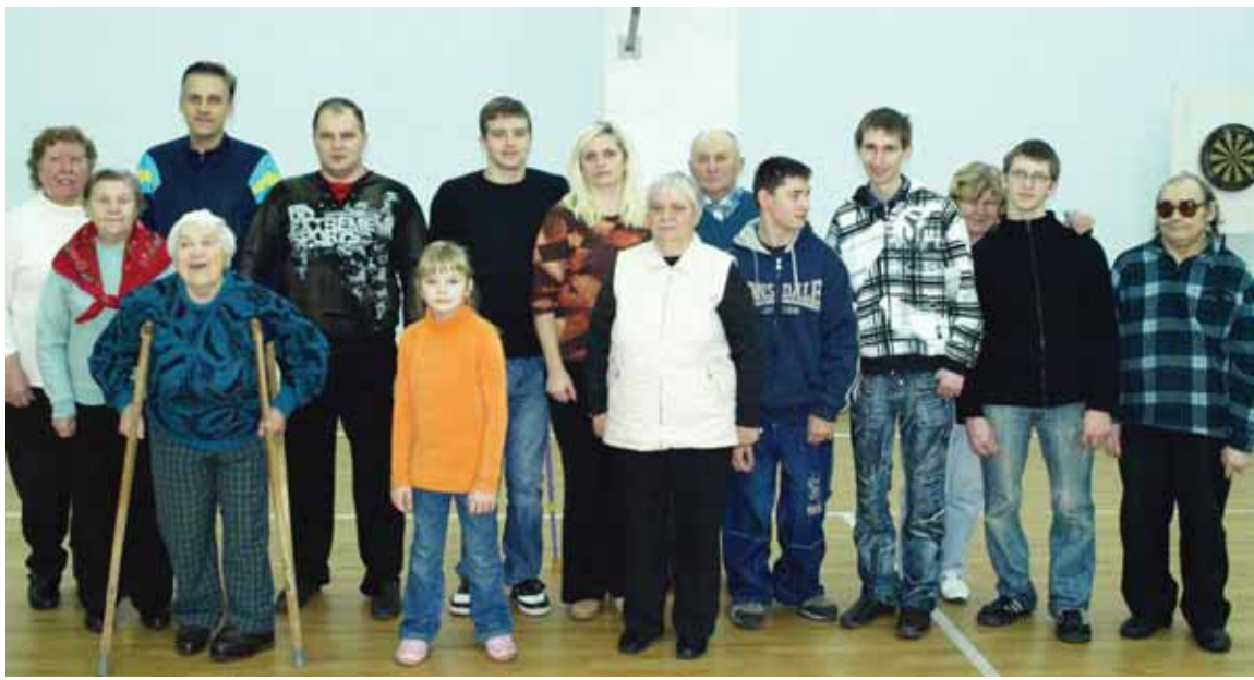
Druskininkų invalidų - sveikatingumo sporto klubo „Lemtis“ nariai, varžybų, skirtų Pasaulinei žmonių su negalia dienai, dalyviai