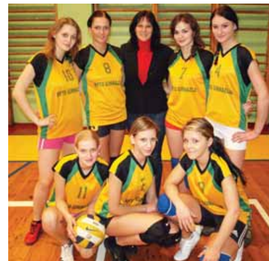
„Ryto“ gimnazijos tinklininkės, kalėdinio turnyro nugalėtojos

● „Atgimimo“ vid. mokykloje vykusiame merginų kalėdiniame tinklinio turnyre dalyvavo Lazdijų sporto centro ir M.Gustačio gimnazijos, Varėnos „Ažuolo“ vid. mokyklos, Druskininkų „Ryto“ gimnazijos ir „Atgimimo“ vid. mokyklos komandos. Nugalėtojų taurę iškovoję „Ryto“ gimnazijos merginos, nepralaimėjusios nei vienerių rungtynių. 2 vietą užėmė mūsų