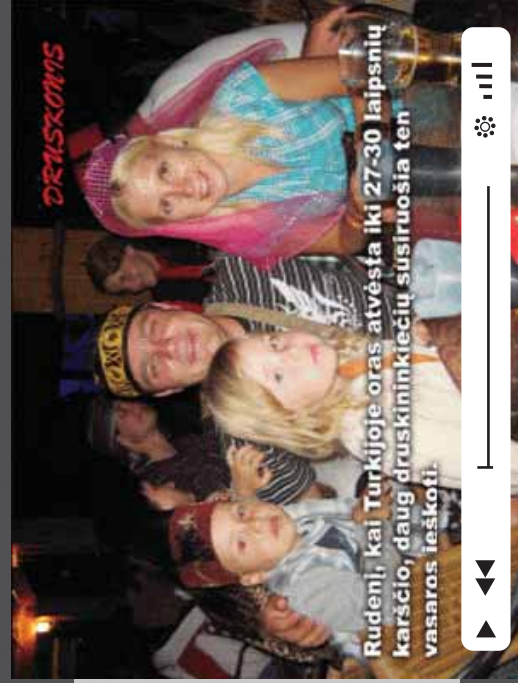
Rudenį, kai Turkiijoje oras atvėsta iki 27-30 laipsnių karščio, daug druskininkėlių susiruošia ten vasaras ieškoti.