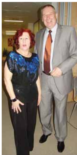
Vicemerė K.Miškinienė su Lietuvos ambasadoriumi Lenkijoje E.Meilūnu