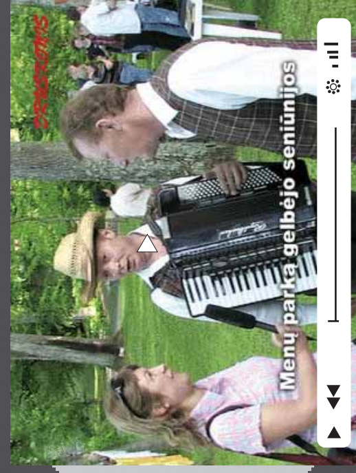
Menų parką gelbėjo seniūnijos