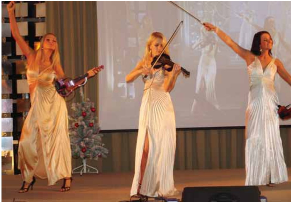
Žavių smuikininkių trijulė „Electric ladies“ virpino ne tik sielas