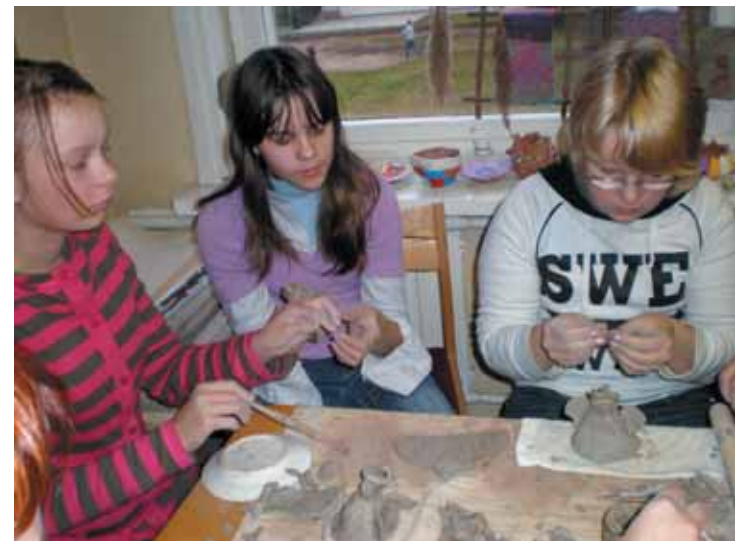
Mergaitės kuria angeliukus

Projekto metu Viečiūnų vaikai organizavo renginius ir savo mokykloje. Kartu su istorijos mokytoja V. Palubinskiene surengė kariuomenės 90-mečio minėjimą. 5 kl. mokiniai kartu su savo auklėtoja S. Muzikevi-