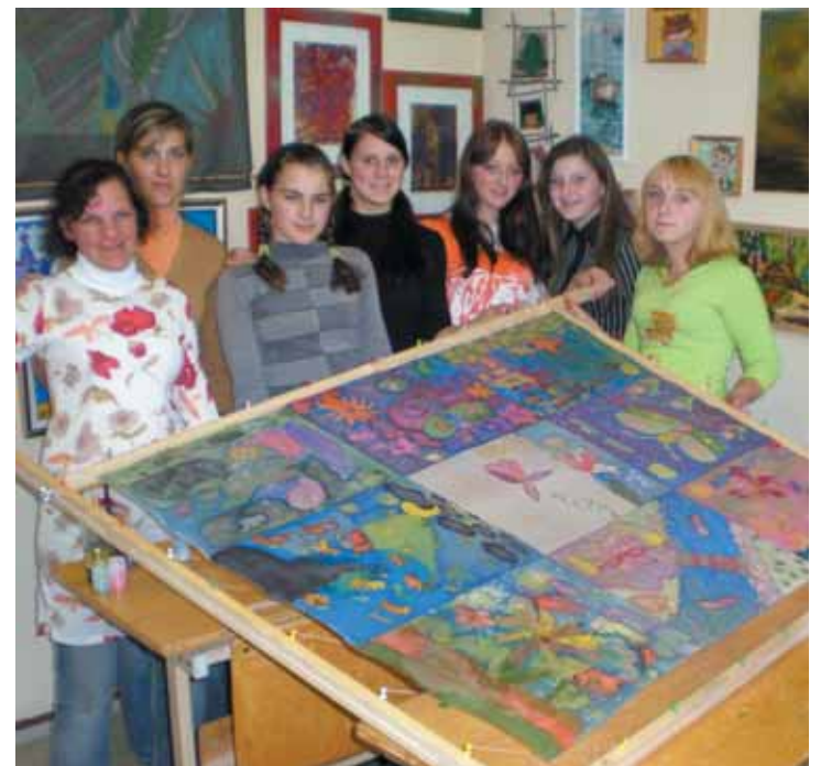
Tapymas ant šilko