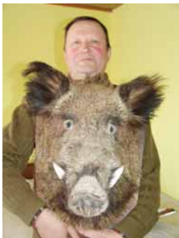
Šis šernas svėrė 600 kilogramų

per 30 medžioklės metų, A.Žiogelis neveda. "Oi, daug... - tegali atsakyti jis. - Būdavo, kad per sezoną nušauti 5-7 stirninus. Tiesa, vilko nesu dar nukovęs. Būna malonu, kai elnių paguldai - gera, raguotą, tačiau jų beveik nebėra. Pasitraukė, nes miškai kertami. Užtat dabar gaunam licencijas medžioti tik elnių pateles".