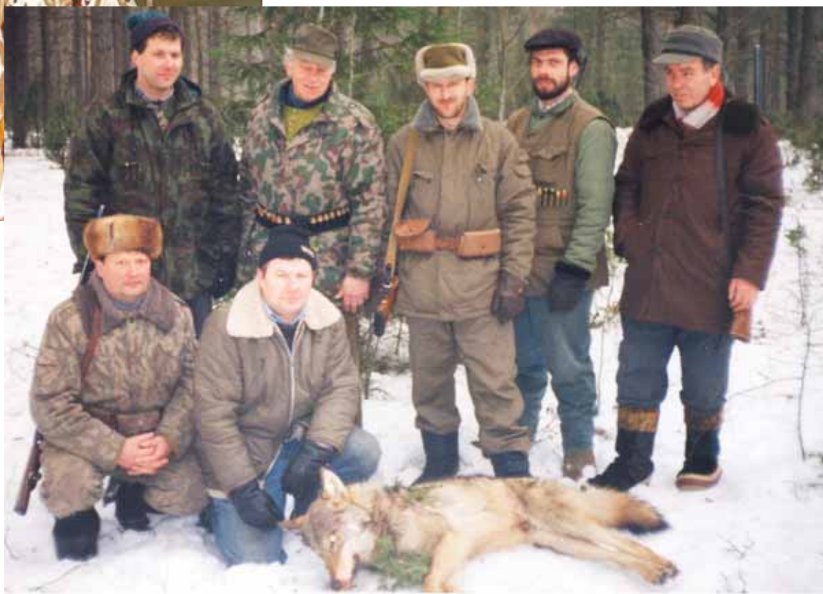
Medžiotojai pozavo prie nušauto vilko

nus mėsos ir atiduoda žmonoms paruošti? A.Žiogelis prisipažįsta, jog turėjęs dvi žmonas, auginęs dvi dukras, dabar jau 22-jus metus gyvena vienas, tad dorotis su žvėriena tenka pačiam. Pasigamina viską - ir dešras kemša, ir mėsą konservuoja, ir troškinius troškina. "Atlieku visas šeimininkės pareigas, - juokiasi vyras. - Gyvenimas privertė".