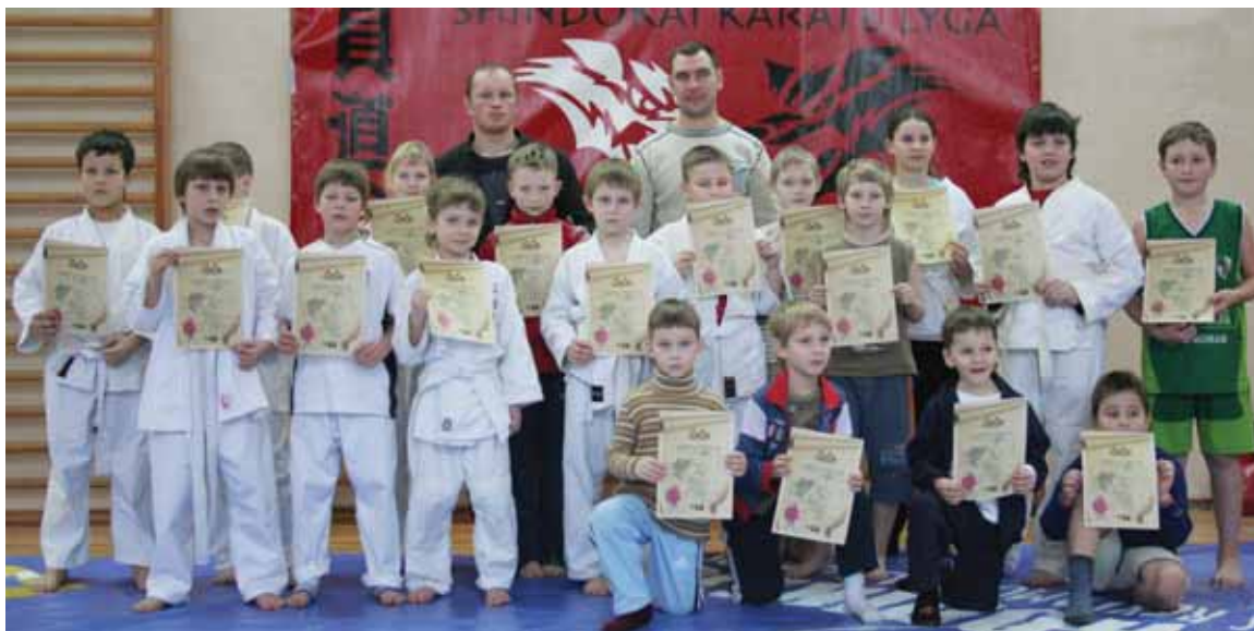
Sausio 31 d. Druskininkų shindokai karate sporto klubas „Du vilkai“ sanatorijos „Belarus“ sporto salėje organizavo apskrities sumo varžybas tarp Alytaus ir Druskininkų vaikų iki 12 metų