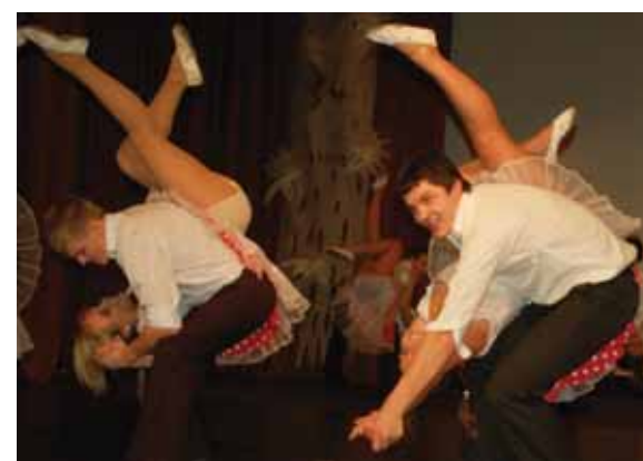
„Ryto“ gimnazijos abiturientai ir vaidino, ir šoko