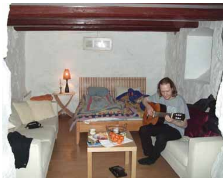
Saulius norvego Thomo namuose