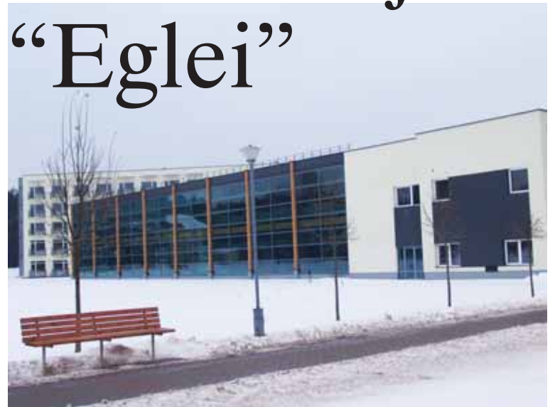
Netrukus bus atidarytas „Eglės“ sanatorijos naujas gyvenamasis kompleksas ir gydymo centras

V asario 19 d. Trakuose Nacionalinė SPA asociacija paskelbė ir apdovanojo geriausius Lietuvoje SPA centrus. SPA nominacijų kategorijoje Druskininkų „Eglės“ sanatorija pripažinta geriausiu medicininės ir sveikatinimo pakraipos (tikslinio SPA) centru. SPA – tai lotyniškos frazės „sanitas per aqua“ (pažodžiui – sveikata per vandenį) santrumpa. SPA vardu vadinamos specialiai įrengtos įstaigos, kuriose atliekamos įvairios procedūros, skirtos fizinės ir psichinės sveikatos gerinimui, atsipalaidavimui, geros savijautos skatinimui, kūno gražinimui ir lėpinimui.