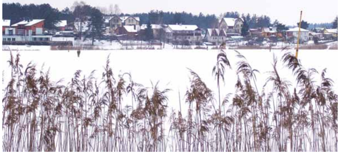
Verslininkas jau pradėjo rūpintis išsinuomotu tvenkiniu

Todėl praėjusių metų lapkritį internete pamatęs nuomojamų Alytaus apskrityje ežerų sąrašą, verslininkas nusprendė dalyvauti aukcione. “Tas sąrašas buvo ilgas. Be Vijūnėlio, ten dar buvo Aviris,