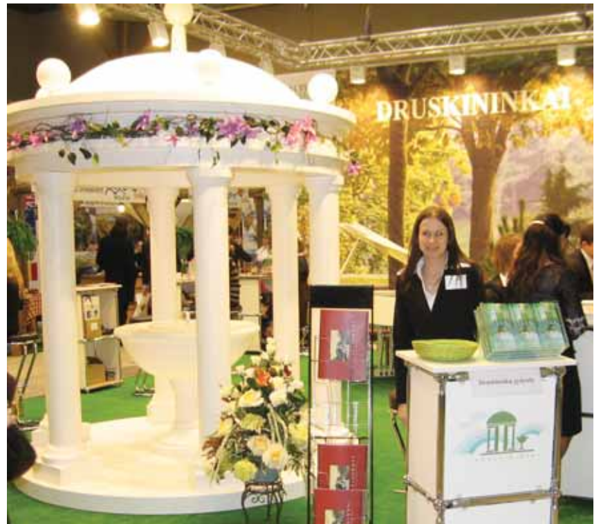
Mineralinio vandens biuvetę pagamino Amatų mokyklos meistrai

Vasario 27- kovo 1 d. „Litexpo“ parodų rūmuose Vilniuje vyko 15-oji tarptautinė turizmo ir laisvalaikio paroda „Vivattur 2009“. Nors savo dydžiu paroda buvo mažesnė už praėjusių metų renginį, kuriame prisistatė 338 dalyviai, šiemet paroda sulaukė nemažai norinčių dalyvauti – teikiamas paslaugas pristatė daugiau nei 200 parodos dalyvių. Lankytojų skaičiumi paroda nusileido praėjusių metų renginiui, tačiau Druskininkų standas be maž visą laiką buvo apsuptas lankytojų. Druskininkiečiai parodos dalyvius nustebino originaliu stendu – akį traukė Druskininkų kurorto simbolis – Amatų mokyklos meistrų pagaminta mineralinio vandens biuvetė, o susirinkusiems fortepijonu skambino specialiai į šį renginį iš Vokietijos atvykusi druskininkietė pianistė Guoda Gedvilaitė.