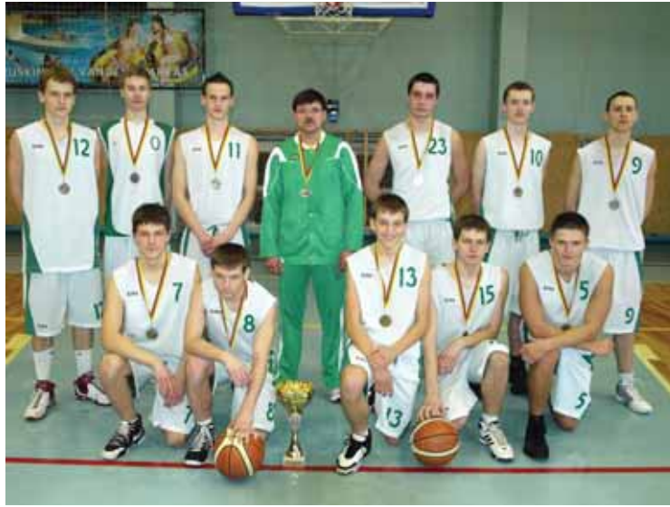
Druskininkų savivaldybės II lygos krepšinio čempionė - „Atgimimo“ vid. mokyklos komanda