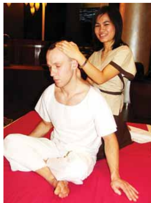
Taidietiškas masažas - populiariausias Druskininkuose

„Jaučiamės lyg rojuje“, - šypsosi Druskininkuose gyvenančios taidietės. Bendrovė joms kurorto senamiestyje išnuomojo du butus, apstatė baldais, aprūpino buitine technika. Moterų kolegės, „East island“ darbuotojos, atvykėlėmis rūpinosi kaip mamos: rodė, kaip veikia mūsų buitines priemais, vedžiojo už rankų po kurorto parduotuves, aiškino, kaip supakuoti jų vartojami maisto produktai, nešė iš namų šiltus rūbus. „Iš pradžių buvo visko, ir prisiirkdavo ne to, ko reikia. Buvo smagu žiūrėti, kaip jos reagavo pirmą kartą pamačiusios sniegą. Lietė rankomis ir šaukė iš džiaugsmo kaip maži vaikai, - šypsosi R.Čaplikaitė. - Taidietėmis rūpinomės visi ir džiaugėmės, kad nei viena, neištverusi mūsų šalčio ir darganų, anksčiau laiko namo neišskrido. Moterys, aišku, ilgisi