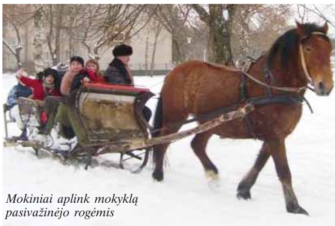
Mokiniai aplink mokyklą pasivažinėjo rogėmis