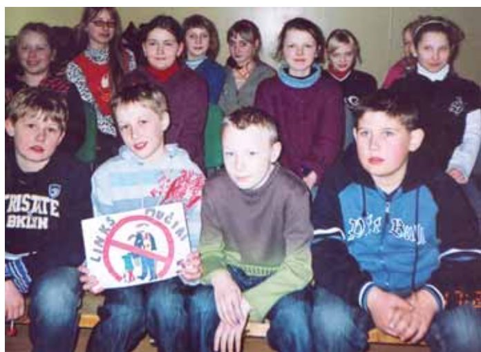
Viena iš dalyvavusių valančiukų konkurse komandų

Vasario 26 d. popietę „Saulės“ pagrindinėje mokykloje įvyko 5-ųjų klasių valančiukų konkursas, kuriame dalyvavo apie 50 mokinių. Iš viso šioje mokykloje yra 78 valančiukai penktokai.