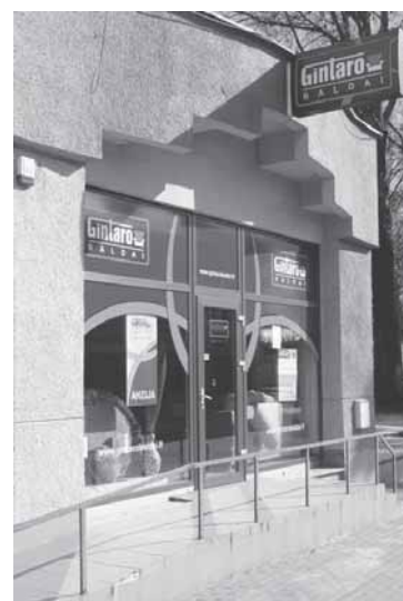
„Gintaro baldų“ salonas Druskininkuose, Vilniaus al. 10 (įėjimas iš šv.Jokūbo gatvės)