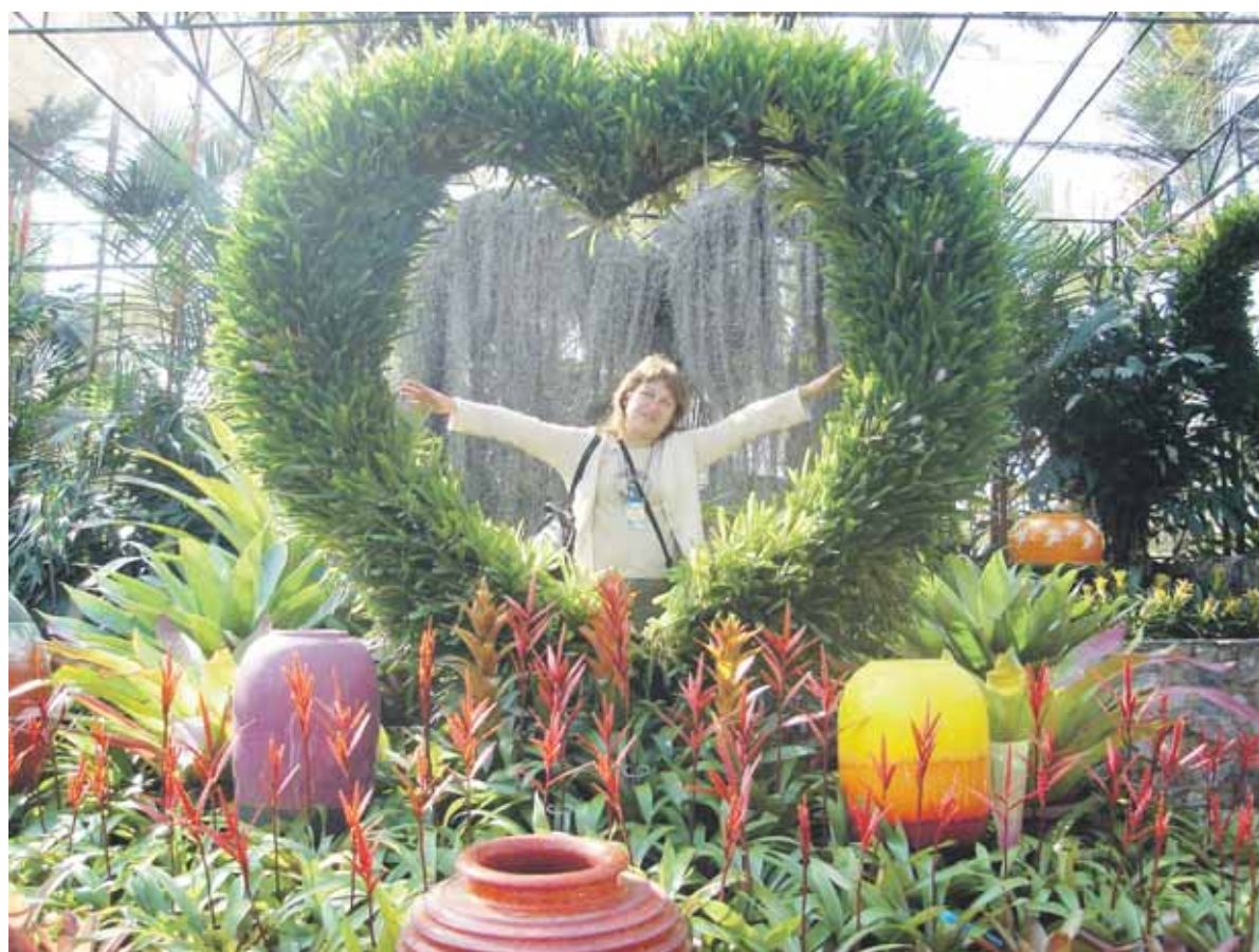
Orchidėjų sodas - spalvų ir formų įvairovė

N uo praėjusių Kalėdų kas dvi savaitės ketvirtadieniais iš Vilniaus oro uosto dar vis kyla laineriai į Tailando sostinę Bankoką. Ir kaskart tarp margos turistų minios į lėktuvą sėda bent po keletą druskininkiečių. Kas juos vilioja į šią egzotišką Azijos šalį?