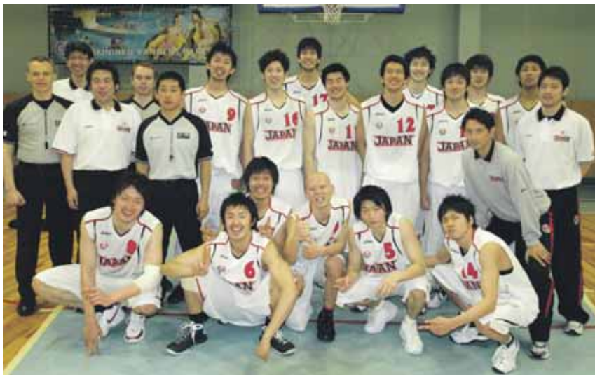
Japonijos krepšinio studentų rinktinė Druskininkų sporto centre

● Organizuojamo Druskininkų savivaldybės vyrų rankinio čempionato komandų vadovai kviečiami atvykti į Sporto centrą balandžio 8 d. 17 val. pasitarti dėl rankinio varžybų.