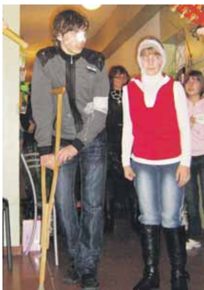
Blaivybės renginys Druskininkų sanatorinėje mokykloje

Susitikimuose su sanatorijos vaikais nuolat dalyvauja ir Panaros pilnų namų bendruomenės vienuoliai, kurie pasakoja apie savo gyvenimo klystkelius ir pavojus, kurie taipogi tyko jaunimo.