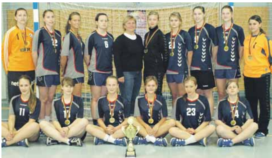
Druskininkų SC merginų komanda - Lietuvos rankinio federacijos moterų čempionato nugalėtoja