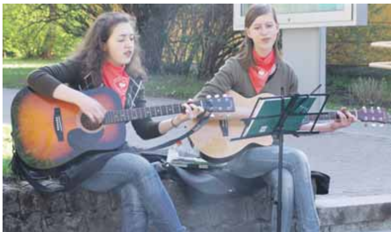
Lyriškas dainas apie meilę liejo merginos

P irmąjį gegužės šeštadienį Lietuvoje į gatves muzikuoti išėjo tūkstančiai žmonių. Druskininkai buvo ne išimtis. Kelios dešimtys muzikuojančių gyventojų, daugiausiai jaunimo, Vilniaus alėjoje praėjusį šeštadienį surengė tikrą gyvos muzikos koncertą. „Gatvės muzikos diena“ - šventė, vienijanti visus, kalbančius universaliausia kalba pasaulyje - muzikos kalba. Jau trečius metus iš eilės muzikanto ir aktorius Andriaus Mamontovo kvietimu profesionalūs muzikantai ir mėgėjai plūsteli į šalies gatves, kiemus, skverus ir aikštes. Apsiginklavę įvairiausiais muzikos instrumentais jie groja roką, klasiką, džiazą, avangardą, folklorą, muša Afrikos ritmus. Grojusį druskininkiečių tądien klausėsi būriai pasivaikščioti išėjusių kurorto gyventojų ir svečių. Geros nuotaikos užteko visiems, tik į muzikantų padėtas kepures šimet biro gerokai mažiau. Geriausiose vietose įsikūrę druskininkiečiai tikino uždribę vos po keliasdešimt litų.