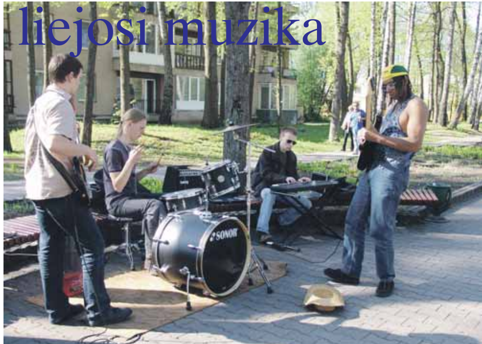
Prie "Sofos" galerijos daug žiūrovų pritraukė internacionalinė – druskininkiečių-prancūzų bliuzo grupė