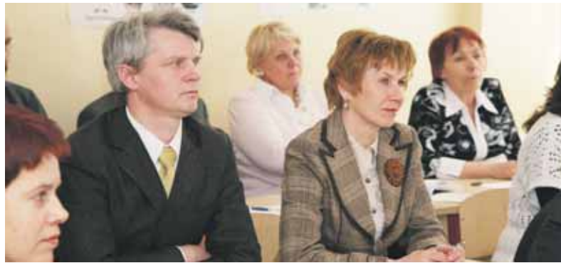
Istorikų metodinė grupė

Matematikos metodinėje grupėje mokytojai svarstė ugdymo turi-