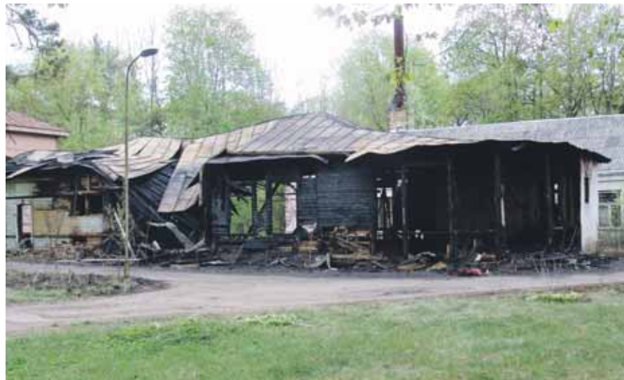
Sudegusi benamių prieglauda V.Krėvės g. 14

Gegužės 3 d., jau po 21 val., priešgaisrinę tarnybą pasiekė žinia, jog kilo gaisras apleistame name Krėvės g.14. Skubiai atvykę ugniagesiai aptiko degančius – čiužinį, fotelį, kitus rakandus, kuriais naudojosi čia apsistoję benamiai.