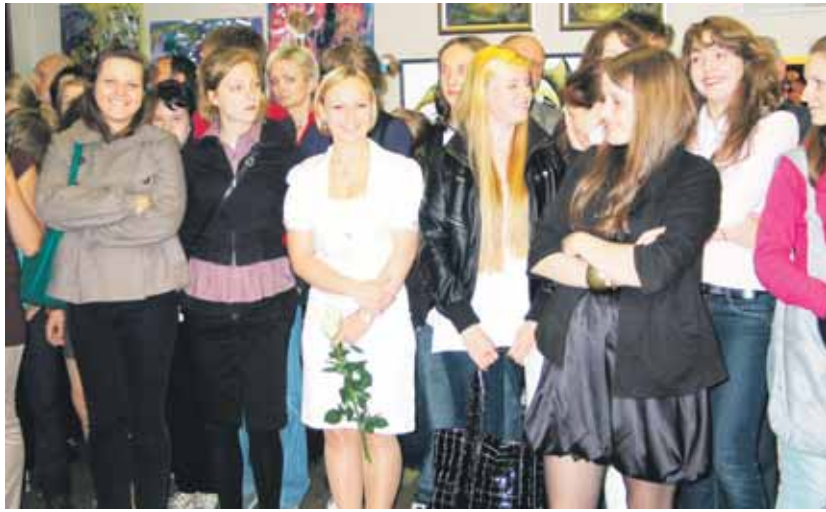
V.K.Jonyno dailės mokyklos diplomantės

Į dvi galerijos sales vos tilpo visų 39-ių jaunųjų menininkų kūryba. Kiekvienas darbas – vis kitoks originaliu sprendimu, atlikimo technika ir niekuo nenusileidžiantis profesionalams. Parodoje galima išvysti ne