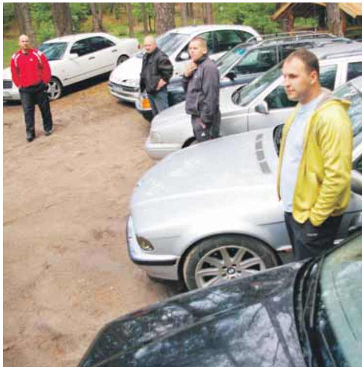
Radio ryšio kelyje mėgėjai susitikę pirmiausia susipažino