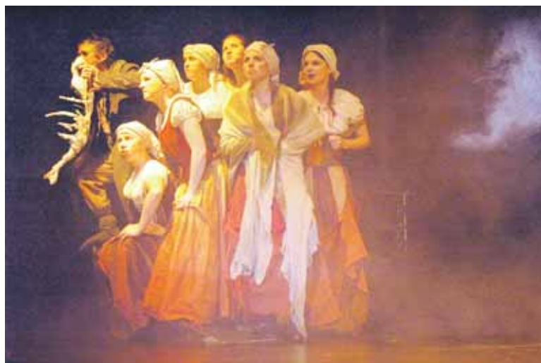
Scena iš miuziklo "Žuvų piemuo"