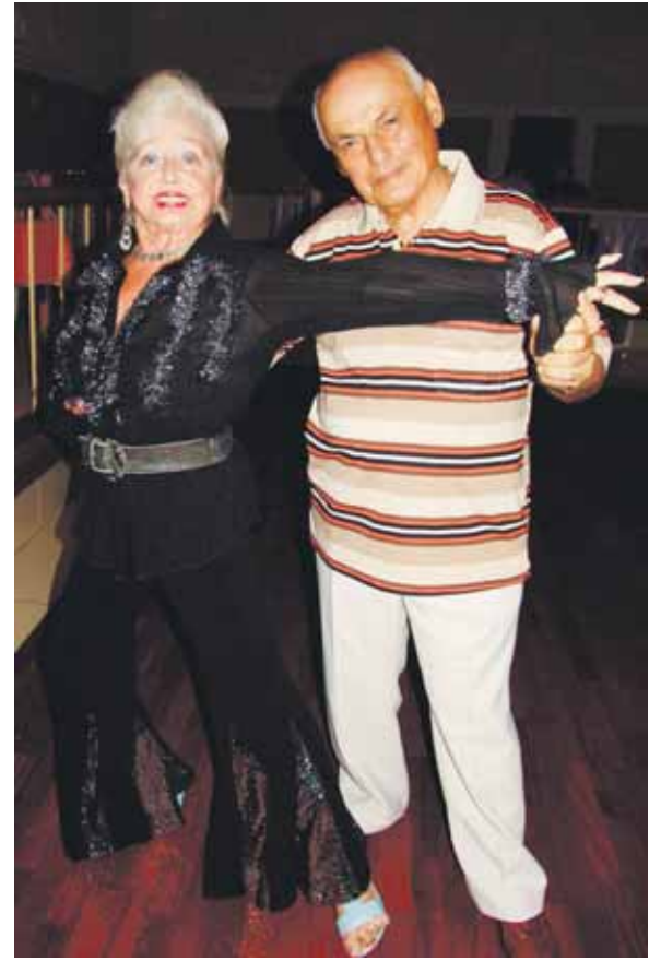
„Šokių karalienė“ abejingų niekada nebūna

žius iki šiol apgaubtas paslaptimi. Ji pati sakosi esanti 76-erių, o kiek šokėjai iš tiesų – devyniasdešimt ar mažiau, žino turbūt tik jos pašas. Paslaptinga ir jos profesija. Gal ši energinga moteris, pasiskelbusi norinti numirti scenoje, iš tiesų yra gyva striptizo legenda? Nejuokaukit, - Džulija save pristato labai rimtai - gydytoja-seksopatologe.