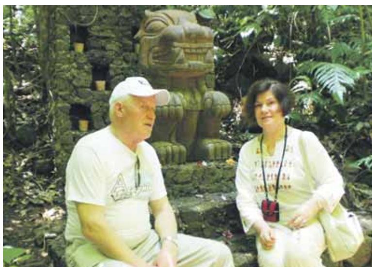
Actekų ir majų takais Meksikoje

ir dideli pastogės skliautai kambarių erdvei praplėsti ir šilumai taupyti,” – komentuoja ponas Povilas.