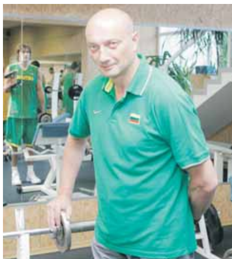
Lietuvos krepšinio nacionalinės rinktinės treniruotės Druskininkų sporto centro treniruoklių salėje