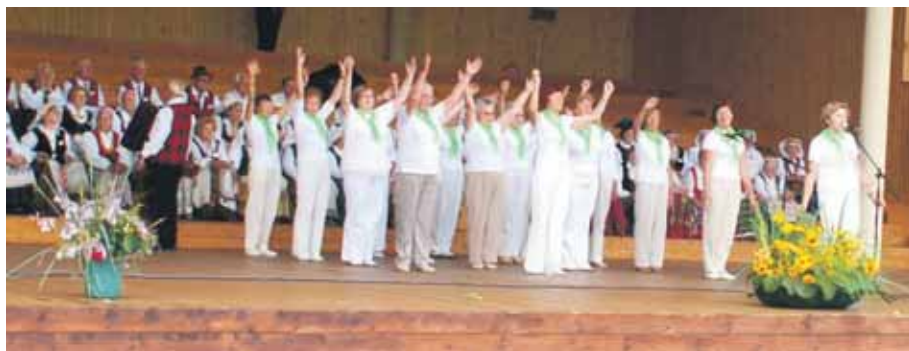
Mūsų “Bočių” sveikuolių elegantiški linijiniai šokiai Veisiejuose susilaukė daug ovacijų