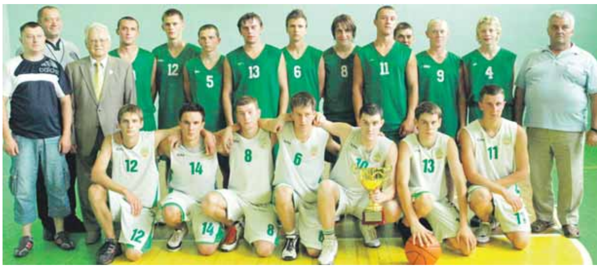
Leipalingio (pirmoje eilėje) ir Seirijų krepšininkai su varžybų organizatoriais