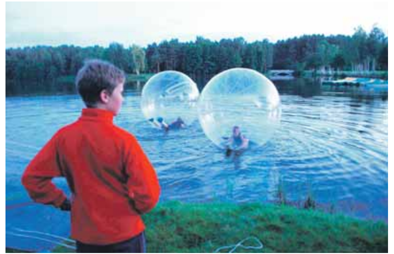
“Odisėja vandeniui” kamuoliuose