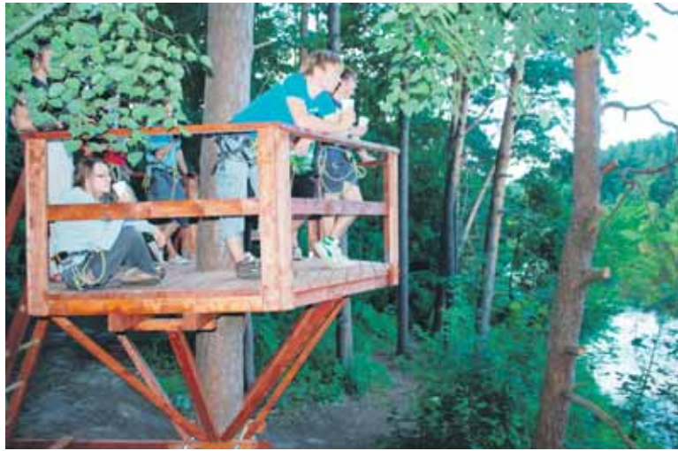
Iš kavinukių medžiuose galima gėrėtis kraštovaizdžiu

Galiausiai „ONE nuotykių parkas“ maloniai kviečia pažymėti šventes ir dovanoja išpūdingas nuolaidas jubiliatams bei varduviniams. Gimtadienio proga teikiama 50% nuolaida, jeigu švenčiate vardadienį – 25%. Nuolatiniai klientai nuo šiol galės įsigyti ir parko pramogų abonementą 1 mėnesiui.