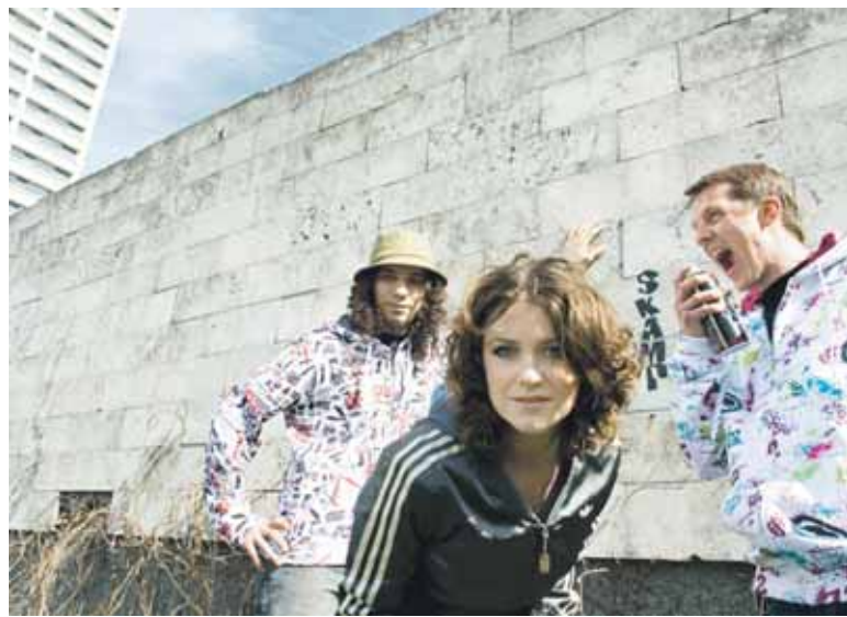
Grupė „Skamp“ praėjusiais metais atšventė savo dešimtmetį