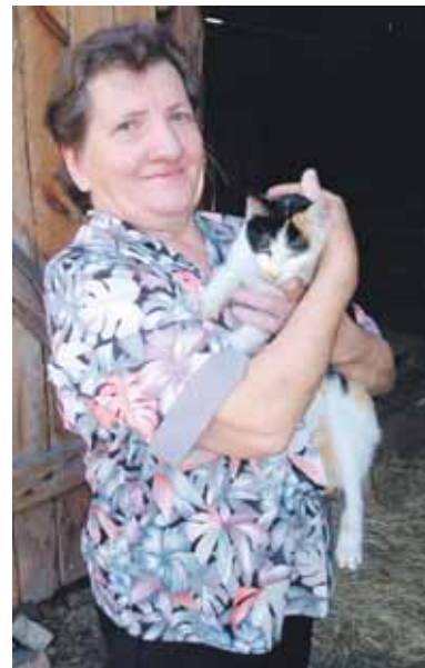
Jadvyga sako, kad kaime gyventi daug geriau, nei mieste