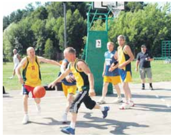
Viečiūnų seniūnijos komanda vyrų, vyresnių nei 41-erių metų, krepšinio varžybose iškovojo 3 vietą

os. Bendroje įskaitoje Druskininkų savivaldybės seniūnijų komandos, tašku atsilikę nuo Alytaus rajono, iškovojo 4 vietą (95 tšk.). ● Kėdainiuose vykusiame tarptautiniame Afganistano karo veteranų ir kitų konfliktų dalyvių asociacijos saskrydyje dalyvavo ir druskininkiečiai, išbandė savo jėgas įvairiose rungtyse. Geriausiai mūs-