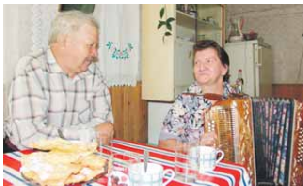
„Labiausiai man patinka, kad ji moka groti armoniką“, - tikina vyras