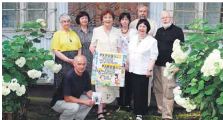
Svečiai iš Gdansko su Mažosios galerijos šeimininkais