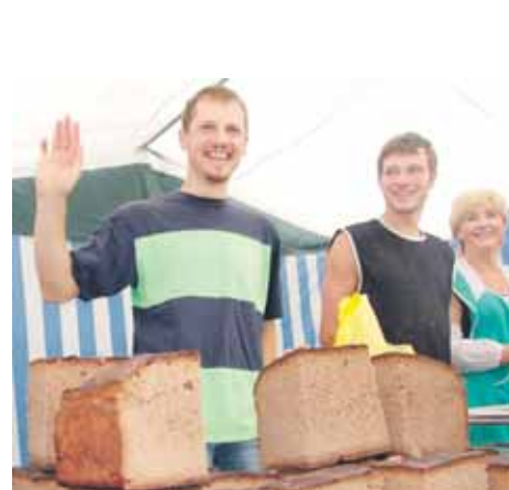
Populiariausias šios mugės pirkinys buvo naminė duona ir rūkyti lašiniai