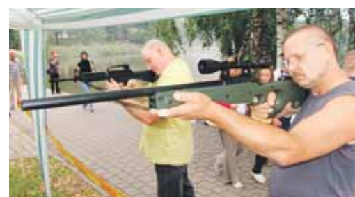
Kuris vyras galėjo lengva širdimi praeiti pro smagiausią užsiėmimą - šaudyklą?