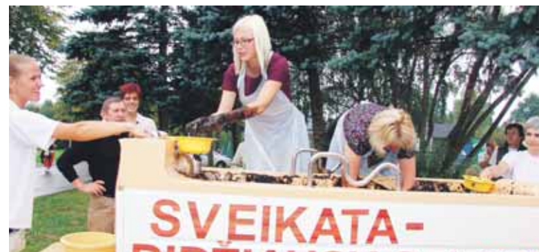
Populiariausia rungtis - "Lobio paieškos purve". Dėl vertingų prizų žmonės nebijojo teptis rankų ir noriai stoji į dalyvių eilę