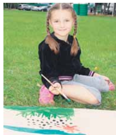
Šventėje netrūko užsiėmimų ir vaikams