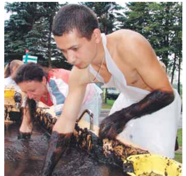
Nors kartą druskininkiečiai nepabūgo kišti rankų į purvą - „purvinoje loterijoje“ buvo galima išlošti įvairaus vandens procedūrų Druskininkų gydymoje bei kitokių prizų