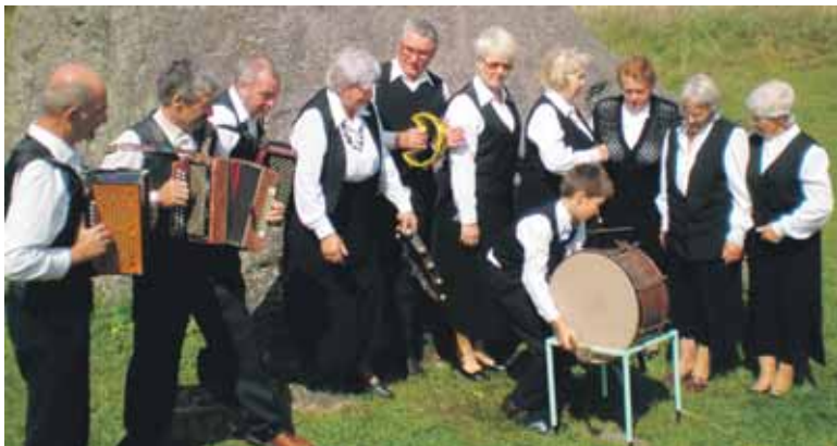
Jaskonių ir Naujasodės etnografinis ansamblis „Malūnėlis“ prie Velnio akmens Švendubrėje