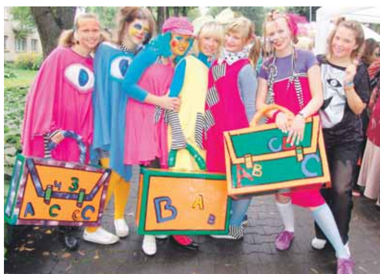
Gatvės teatro aktoriai buvo ryškiausi darganotos dienos herojai