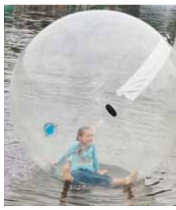
Vaikus viliojo „kosminiai“ burbulai Druskonio ežere