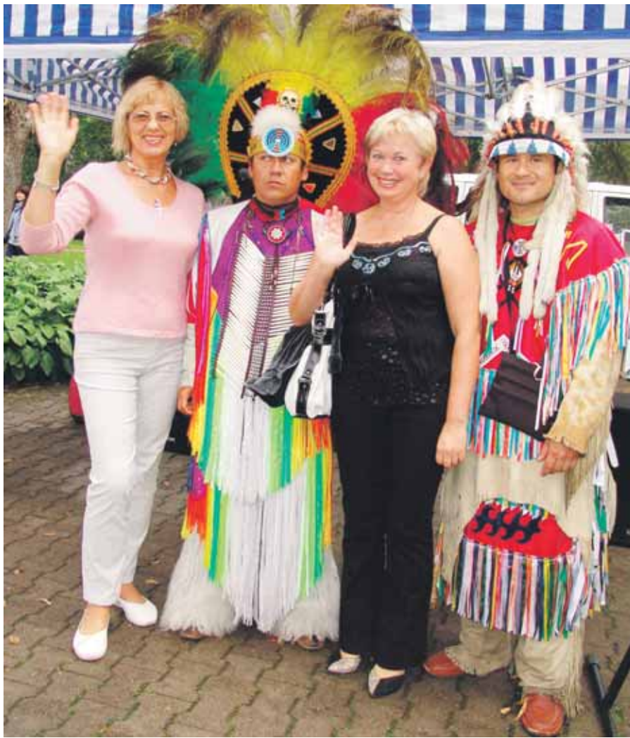
Šventės egzotika - gyvi indėnai mielai fotografavosi su druskininkiečiais. Nuotr.: Janina Klimienė ir Danutė Sviklienė su plunksnuotaisiais muzikantais

Įkyriai pliaupiant lietui, praėjusį šeštadienį, rugpjūčio 29-ąją, Druskininkai atsisveikino su vasara.