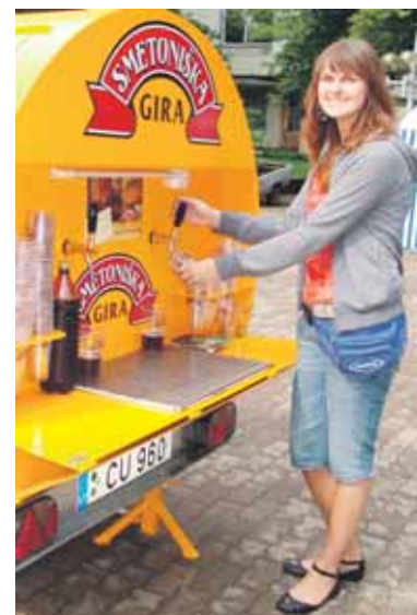
Girai, o dar smetoniškai, atsispirti buvo sunku