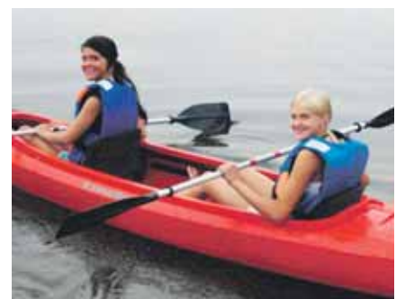
Atsisveikinimo su vasara šventės „Vasaros aidai“ metu vyko daug sportinių varžybų