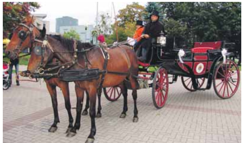
LIONS klubai į kurortą suvažiavo ir prabangiais automobiliais, ir karališkomis kariatomis