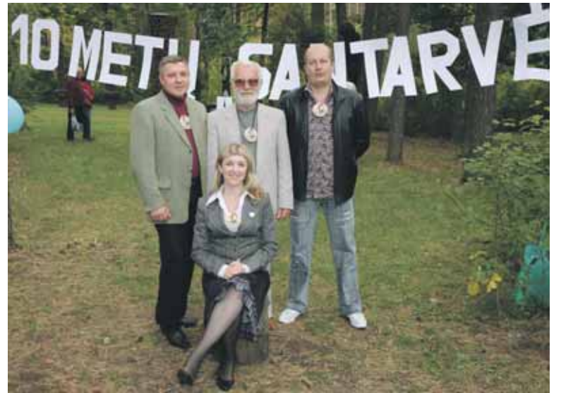
Bendrijos valdyba, organizavusi šventę

pageidavo, kad pirmoji namo gyventojų šventė būtų ne paskutinė. Jau kyla mintys, kad bendrijos vaikus aplankytų Kalėdų senelis,