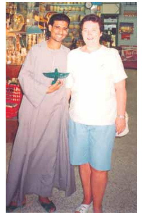
Svetingų žmonių šalyje - Egipte