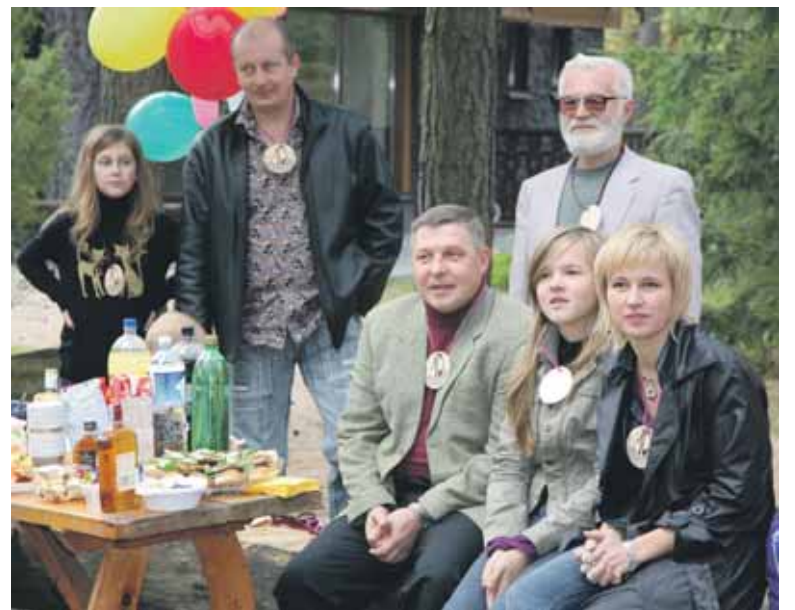
10-mečio medaliais pasipuošę gyventojai sunešė gausų šventės stalą

drauge kaip šeimos sutiktumėm netik Naujuosius Metus, bet ir pažymėtumėm mums svarbias datas. Pats bendrijos pavadinimas "San-