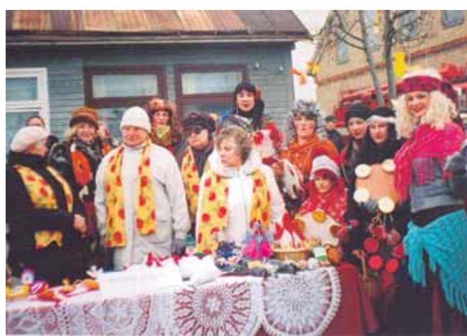
Druskininkų "Kraitės" moterų rankdarbių paroda Simne

šes. Pasidalinsime pigaus lietuviško maisto gaminto receptais ir