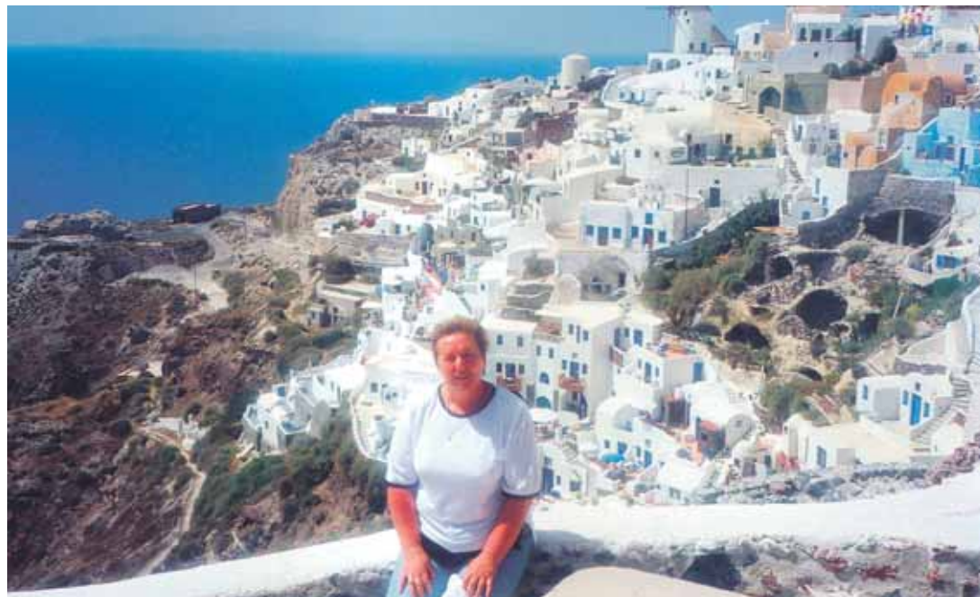
Užburiantis Santorino salos grožis