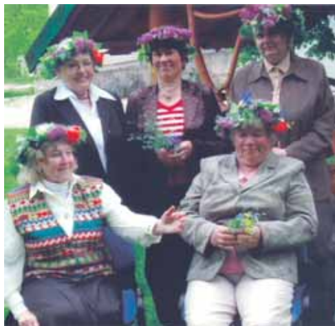
Etnoklubo "Kraitė" moterys

Tik buvimas draugėje, jaukioje kompanijoje sklandanti sunkmečio bauba nuspalvina šiltesnėmis spalvomis bei įvairių sumanymų romantika. Vieną tokių sandėrį su šiuo sunkmečiu sudarė "Bočių" bendrijos klubas "Kraitė". Spalio 15 d. 14 val. Soc. paslaugų centro apskritojo stalo salėje surengsime lietuviškų mišrainių parodą ir vai-