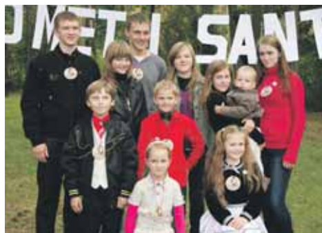
Daugiabučio Veisiejų g.16 vaikai