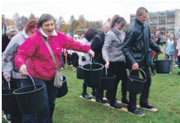
Slidėmis ant žolės su pilnais kibirais vandens

Nepaisant lietaus, aikštėje prie Viečiūnų seniūnijos linksmai šurmuliavo šventės dalyviai. Kas gėrėjosi vietinių sodininkų atvežtomis gėrybėmis, kas dairėsi po dailės dirbinių prekystalius. Kiti dalyvavo linksmose varžybose – su