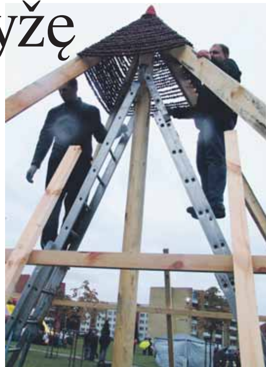
Kaštonų piramidės statybos darbai tik prasidėję