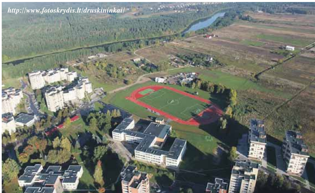
Naujasis Druskininkų stadionas iš paukščio skrydžio