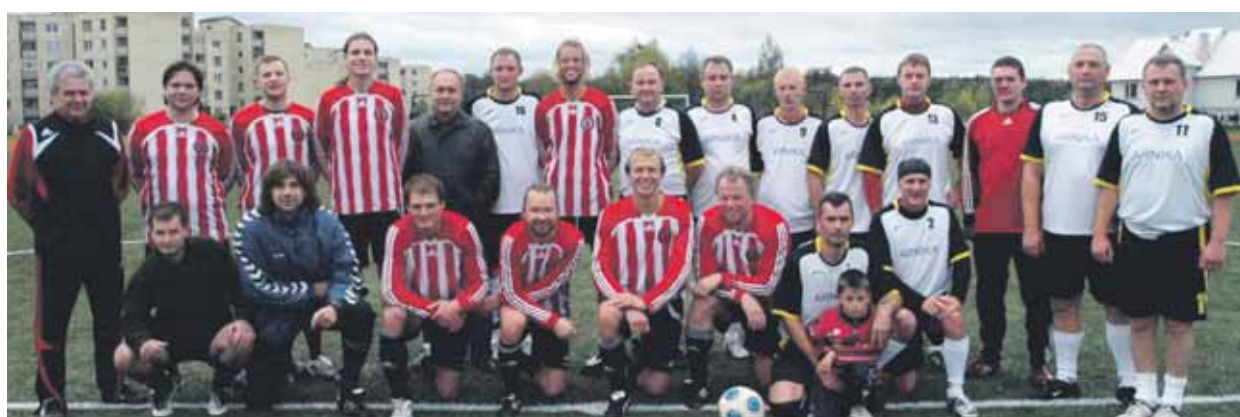
Spalio 9 d. naujojo Druskininkų futbolo stadiono dangą išbandė FK „Arnika“ ir FK „Prelegentai“ komandos. Vilniečiai, tarp kurių buvo nemažai pramogų verslo atstovų, nugalėjo druskininkiečius 5:3

! Sporto centrą kviečiami pasitarti organizuojamo mūsų savivaldybės vyrų I ir II lygos krepšinio čempionatų komandų vadovai: I lygos - spalio 20 d. (antradienį) 17 val., o II lygos - spalio 27 d. (antradienį) 17 val. Išsamiau tel. 58051.