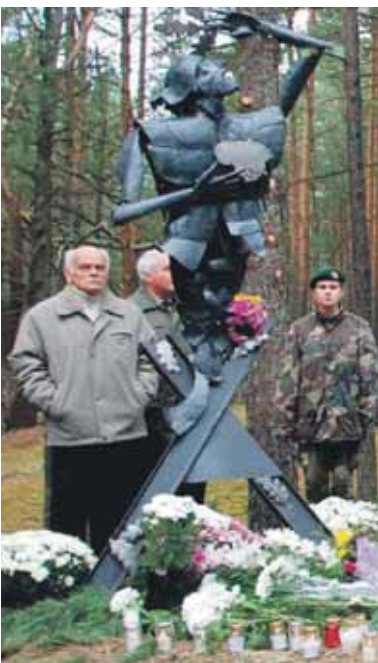
Paminklo „Šaudyta Lietuva“ (autorius druskininkietis Gintaras Žilys) atidengimas 3 psl.