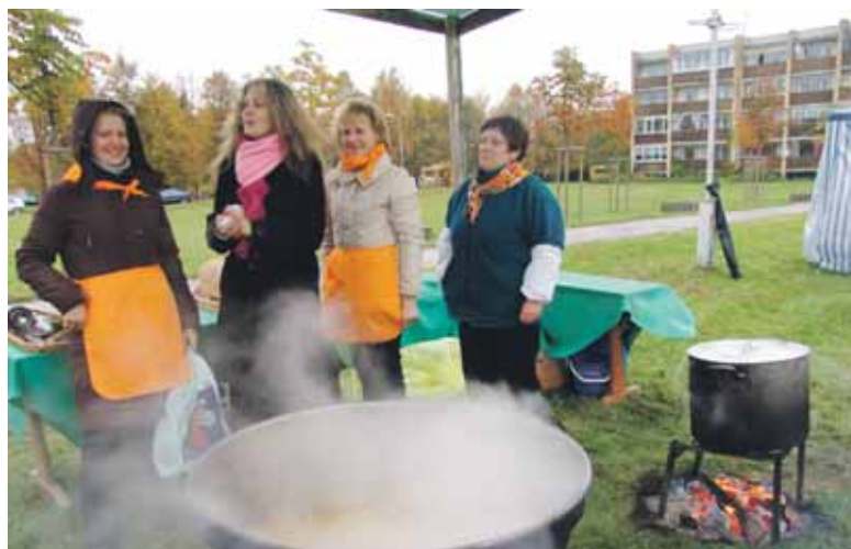
Buvo galima pasivašinti vaistažolių arbata, gira ar karšta sriuba

Nuo spalio mėnesio MAXIMOJE iki 25 proc. atpigo beveik 1000 skirtingų prekių. Neieškok kitur. Savo pamėgtus kokybiškus produktus pirk pigiau MAXIMOJE.