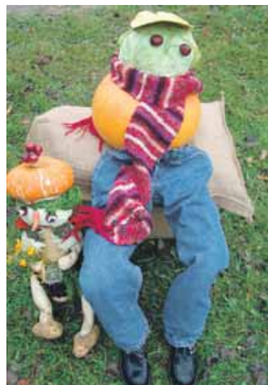
Šis šventės svečias buvo nebylus - jis sumeistrutas iš įvairių daržo gėrybių