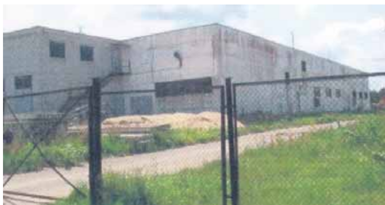
Patalpas “Stikloporas” išsinuomavo Viečiūnų fabrike

Sprendimą įkurdinti putstiklio gamyklą šalia Druskininkų, pasak