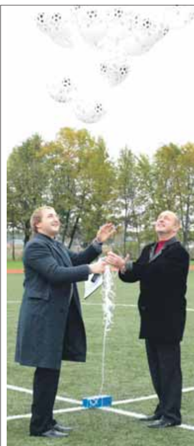
Meras perkirpo juostelę su balionais, simbolizuojančiais futbolo kamuolius