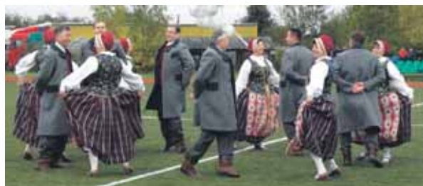
Aikštyno atidarymo ceremoniją pradėjo tautinių šokių kolektyvas „Kadagys“