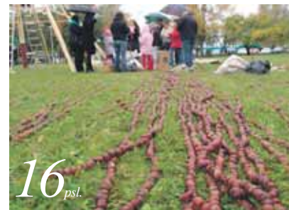
Jau suvertos kaštonų virtinės tuoj atsidurs ant statomos piramidės