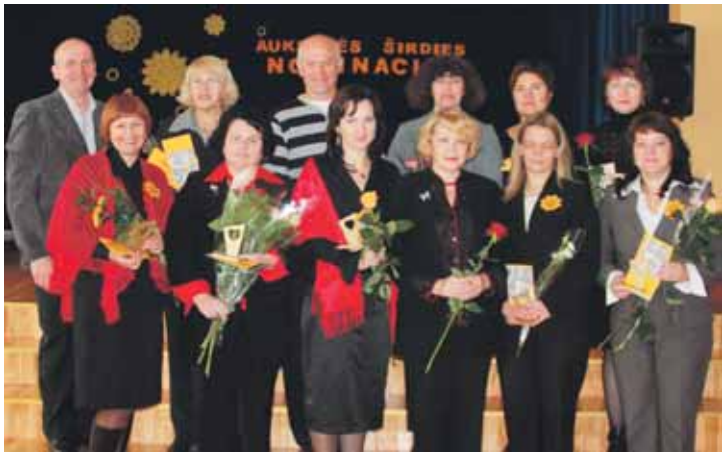
„Auksinės širdies“ nominantai