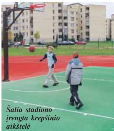
Šalia stadiono įrengta krepšinio aikštelė