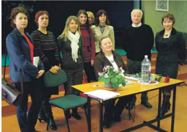
Rašytoja Vanda Juknaitė su „Atgimimo“ vid. mokyklos mokytojais

Kasmet tradiciškai „Atgimimo“ vid. mokykloje vyksta susitikimai su rašytojais. Šį rudenį sulaukėme ir žinomos rašytojos, ir gausaus būrio literatūrologų iš Vilniaus pedagoginio universiteto (VPU).