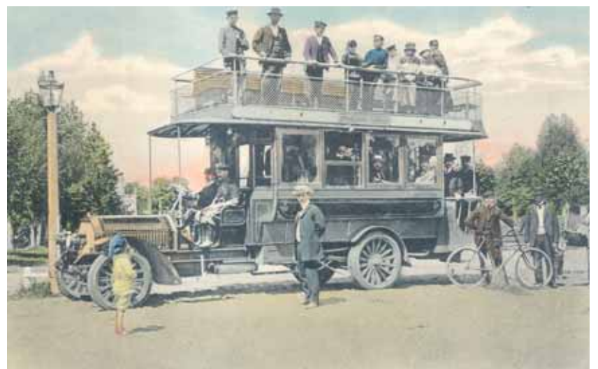
Keleivinis autobusas, tarpukario Druskininkuose atveždavęs poilsiautojus iš Paryčės į Druskininkus, kursavo iki plažo Meilės saloje