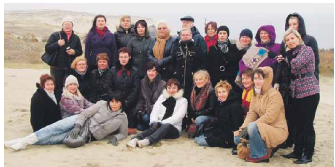
Atgimimo“ vid. mokyklos mokytojai ant kopos Pervalkoje