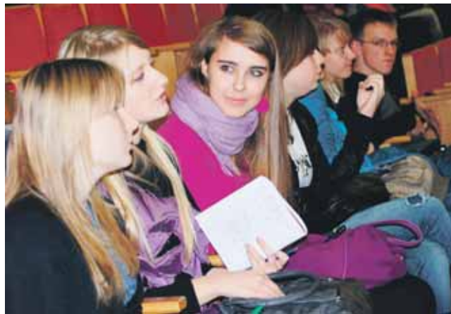
Jaunimo užimtumo centro tarybos nariai