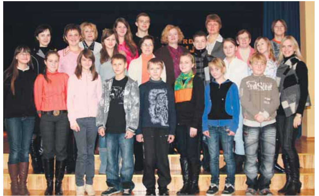
Vertėjai iš „Saulės“ pagrindinės mokyklos su savo užsienio kalbų mokytojomis

Tad mūsų maži darbai sulaukė įvertinimo. Tai paskatins ir ateityje aktyviai dalyvauti tokia- me konkurse.