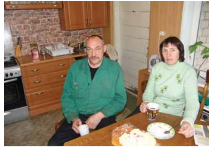
Mizerų darbo diena prasideda 5 val. ryto kava ir ypatingai skaniu šeiminkės sūriu

„Pieno supirkimo kainos galėtų būti didesnės, tačiau krize nesiskundžiam, nes visokio maisto patys turim,“ – sako Mizerai, vaišindami puikaus skonio sūriu su džiovintais vaisiais, kurį pati šeimininkė gamina. Iš 10-ies laikomų karvių kas antrą dieną jie primelžia apie 200 litrų pieno, kurį parduoda Vilkyškių pieninei. Ji už 1 litrą pieno moka ūkininkams po 56 ct. Mizerai laiko 3-is kiaules, todėl ne tik pieno produktų, bet ir mėsos pakanka. Šeima ūkininkauja 23 ha žemės plote, iš kurių 16 ha užima pievos. Kita žemė – ariama bei apšėjama