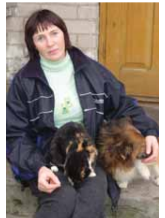
Sodyboje laikomos katės ir šunys tarpusavyje sugyvena kaip šeimos nariai