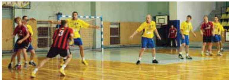
Mūsų vyrų rankinio rinktinė sutriuškino Kauno „LKKA – Teledemos“ komandą