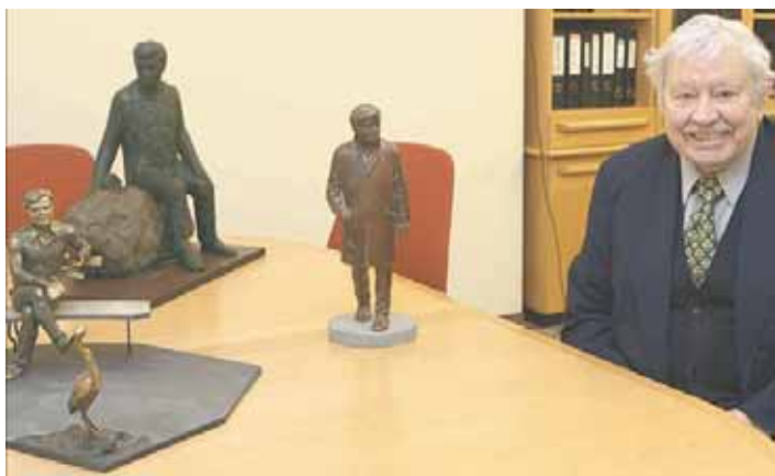
Donatas Banionis šalia skulptūrų jam prie „Grand SPA Lietuva“ projektų

Šalia Druskininkų sveikatos ir poilsio komplekso „Grand SPA Lietuva“ iškilis skulptūra žinomam kino ir teatro aktoriumi Donatui Banioniui.