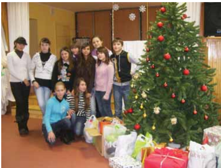
Viečiūnų pagrindinės mokyklos mokiniai su savo dovanomis Alytaus vaikų globos namuose

Jie vežė dovanas, kurias paruošė kartu su tėveliais, parodė meninę programėlę, susipažino su globotiniais ir jų gyvenimo sąlygomis, pasikeitė adresais. Neapsakomas džiaugsmas matant dėkingus naujų draugų veidus, besidžiaugiančius naujais žaislais, knygelėmis, kitomis dovanėlėmis. Nuoširdus bendravimas su likimo nuskriaustais vaikais sujaudino, suteikė dvasios stiprybės. Mūsų mokykla ir Alytaus vaikų globos namai sutarė draugystę tęsti ir ją stiprinti bendrais projektais, renginiais, naujais susitikimais.