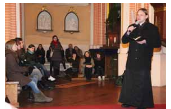
Į Advento vakarą Druskininkų bažnyčioje susirinkęs jaunimas sutūpė ant grindų