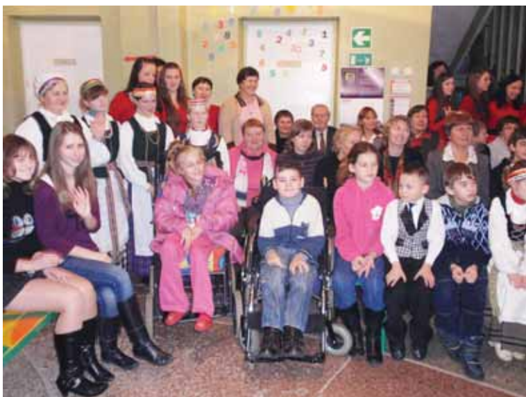
Sanatorinės mokyklos mokiniai su svečiais iš Viečiūnų

Sanatorinės mokyklos bendruomenei labai dėkoja Viečiūnų pagrindinės mokyklos mokiniai ir mokytojoms už gražią vakaronę. Visada laukiame svečių ir iš kitų miesto mokyklų.