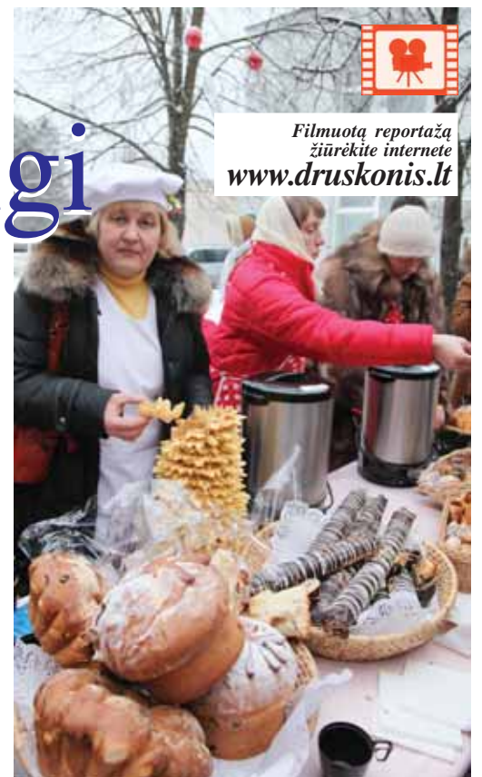
Daugelis rikiavosi prie nemokamais skanėstais nukrauto stalo