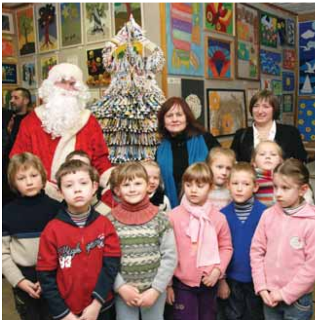
Prie eglutės rekordininkės - patys mažiausieji jos autoriai

"Čia tai bent šventė," - sakė kažkuris iš vaikų. Džiaugsmingas vaikų klebesys – geriausias įrodymas, kad visi liko patenkinti.