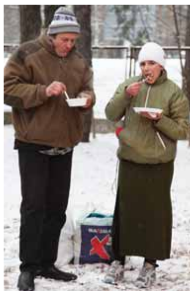
„Kopūstienė labai gardi, ir blynai skanūs. Gerai, kad atėjom“, – sakė 17 laipsnių šalčio neišsigandę žmonės