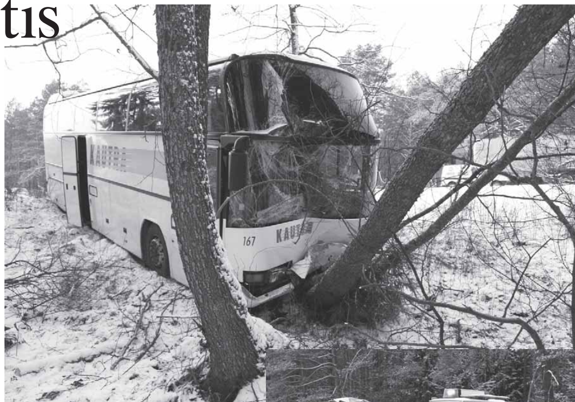
Greitis ir vairavimo nepatirtis praėjusį šeštadienį nusinešė dvi gyvybes. Žiauri avarija prie pat kurorto sukretė daugybę žmonių, tad dienai važiuojusiu keliu Druskininkai-Vilnius. Į mišką nuo kelio nuriedėjęs autobusas specialia technika buvo ištemptas tik vakary