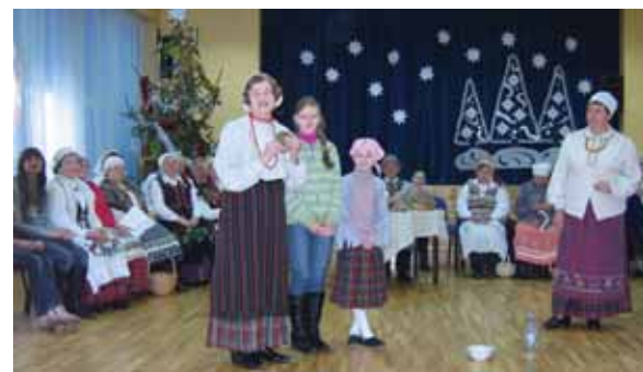
„Bočiai“ svečiuose pas mokinukus