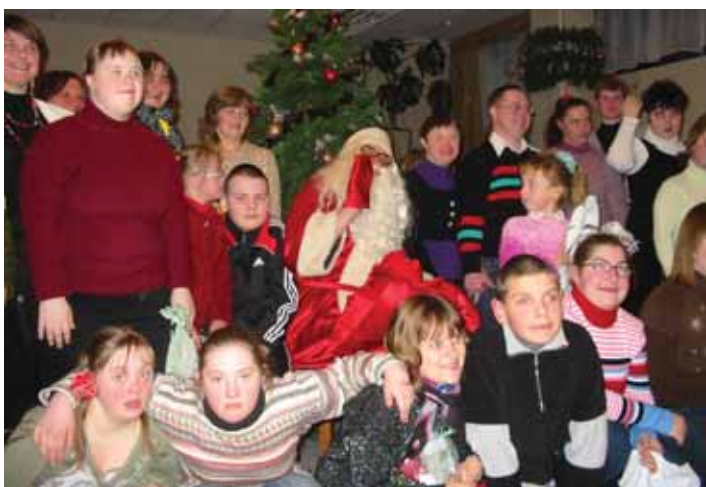
Sutrikusio intelekto žmonių globos bendrijos "Druskininkų viltis" Kalėdų šventėje