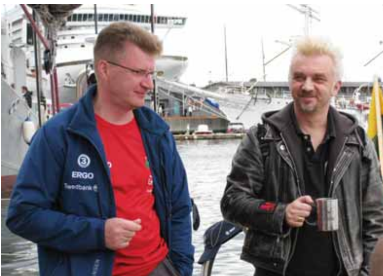
Kelionėse A.Tamauskas susipažino su daugybe žmonių. Nuotr. - su dainininku Andriumi Mamontovu