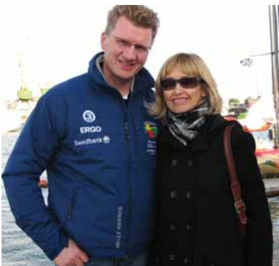
„Mes kartu jau 30 metų“