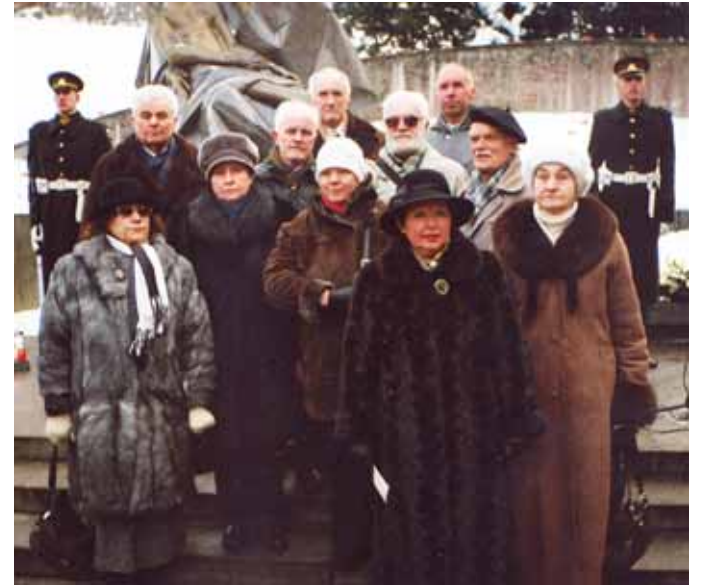
Druskininkų Sausio 13-osios brolijos nariai Antakalnio kapinėse