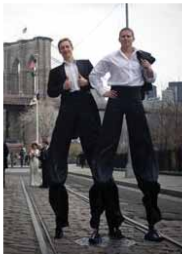
Dueto “GiRo” (Gintaro ir Rolando) pasivaikščiavimai Amerikos gatvėse visuomet lydimi smalsių žvilgsnių

Tikėkim, jog Druskininkai vėl jį atvilios į mūsų kurorto