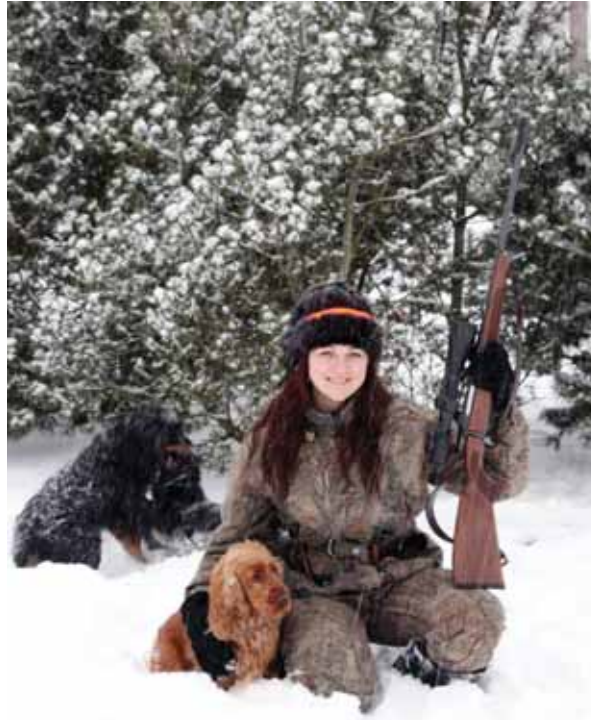
Žiemos šalčiai nebaisūs nei gražiajai medžiotojai, nei jos augintiniams šunims