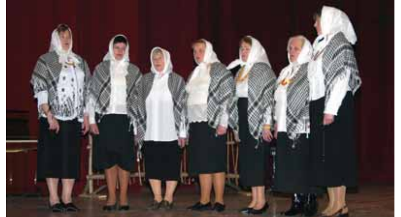
Dainuoja Jovaišių moterys