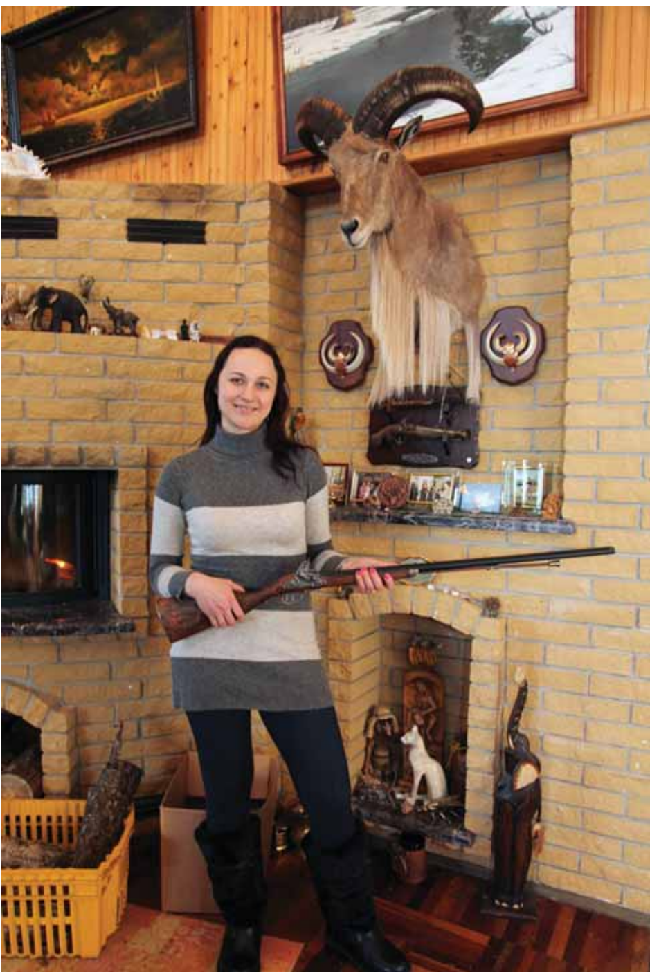
Namo židinį moteris papuošė antikvariniu šautuvu