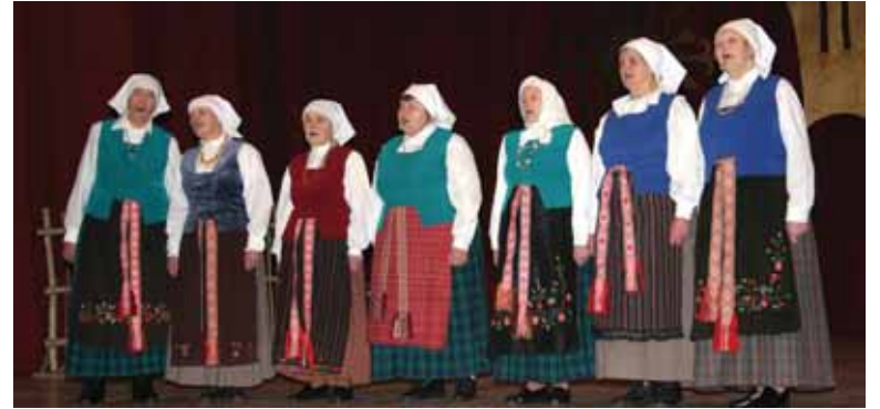
Ricielių bendruomenės pasirodymas