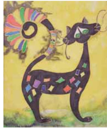
Tokį katiną gali nupiešti ne tik kūrybinga, bet ir linksma asmenybė

Kaip tarė, taip ir padarė, savo rankomis sumūrijo sieną iš didžiulių akmenų. Dabar čia jauki pa-