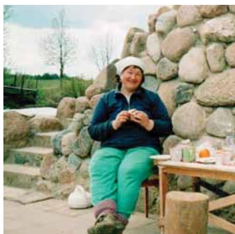
Poilsio valandėlė prie savo mūro

„Labai daug žmonių sakė mums, kad pagalvotume, kur mes lendam“, - pasakojo mama ir dukra apie pažįstamus, kurie netikėdami jų sugebėjimais, bandė atkalbinėti nuo apsiimto sunkaus darbo.