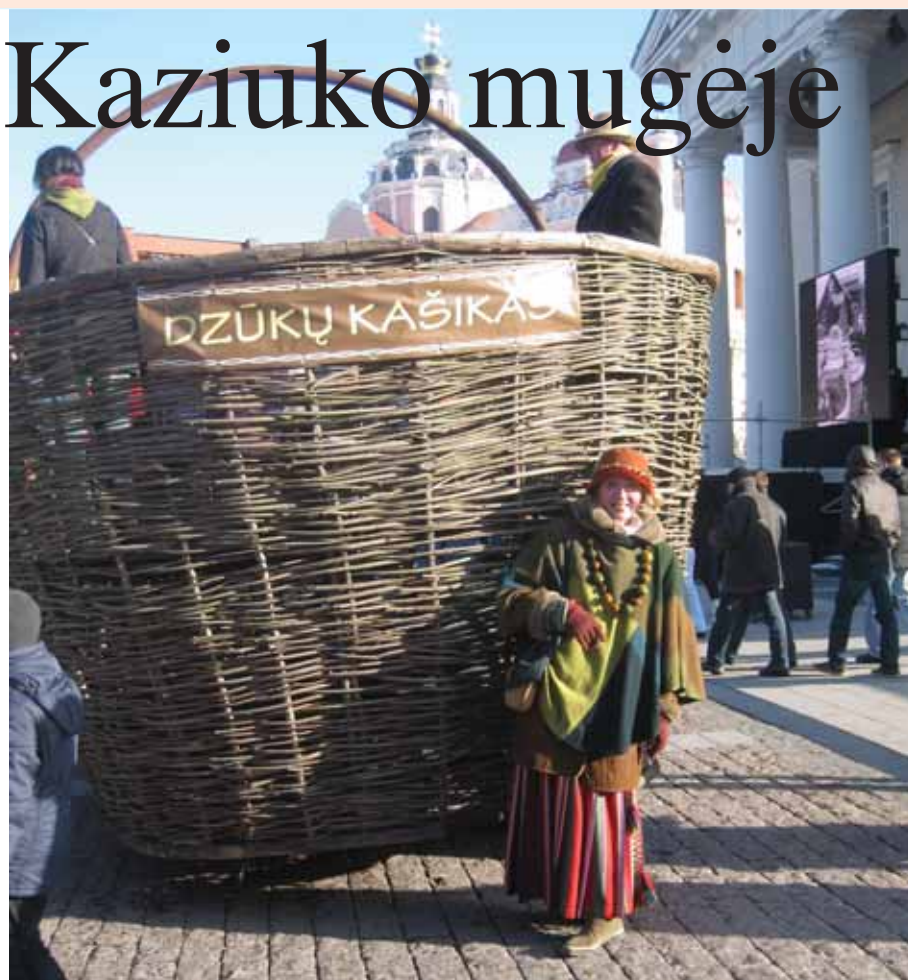
Vaikus ir suaugusius bovino dzūkų kašikas, kuris nuo ryto iki vakaro vežiodavo į jį sugarmėjusius