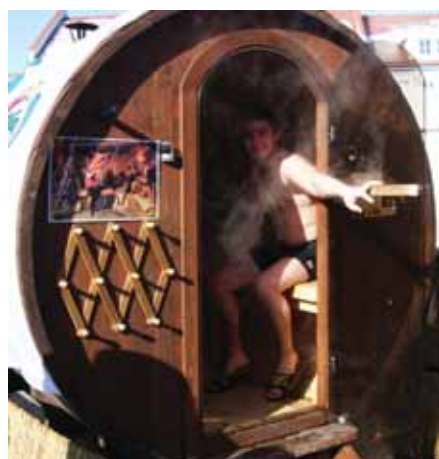
Druskininkų vandens parko pirtelė Rotušės aikštėje Vilniuje