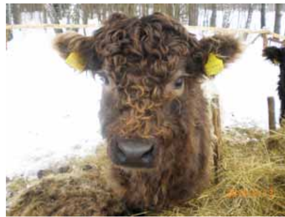
Galovėjai nemėgsta pozuoti