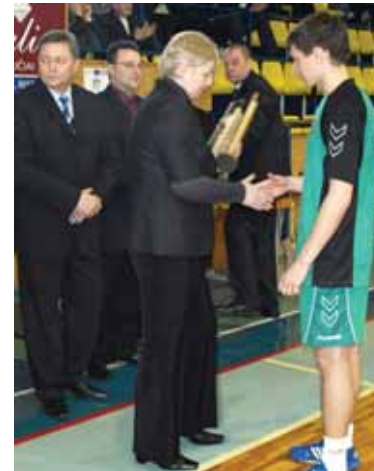
Pereinamąjį turnyro taurę nugalėtojams - Lietuvos jaunių rinktinės kapitonui įteikė G. Matulionio mama

ma vieno rato sistema. 1-ame pogrupyje Druskininkų SC komanda 32:28 įveikė svečius Elbingo, bet 21:24 pralaimėjo Alytaus SC komandai, kuri po įtemptos kovos 16:23 pralaimėjo lenkams. Susumavus tarpusavio įmestų ir praleistų įvarčių santykį, 1-ame pogrupyje 1 vietą užėmė Elbingo komanda, 2-Druskininkų SC, 3 - Alytaus SC. 2-ame pogrupyje Lietuvos jaunių rinktinė įveikė 32:9 Varėnos SM ir 30:8 Vilniaus SM „Tauro“ komandas, o vilniečiai 17:13 įveikė varėniškius. 2-ąją varžybų dieną kovoje dėl 5-6 vietų alytiškiai nugalėjo 22:13 varėniškius. 3-ąją vietą turnyre užėmė Druskininkų SC, nugalėjusi 31:12 Vilniaus SM komandą. Veržlių ir kovingų finalinių rungtynių tarp Lietuvos jaunių rinktinės ir Elbingo „Truso“ komandos tik pačioje pabaigoje paaiškėjo nugalėtojai. Jais tapo Lietuvos jaunieji, nugalėję lenkus - 33:27. Šio turnyro organizatoriai ir rėmėjai