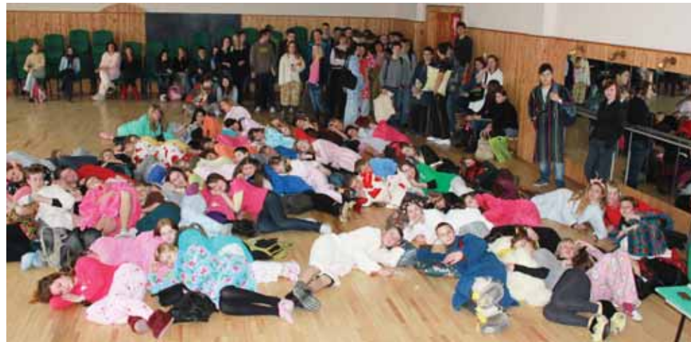
Masinis gimnazistų miegojimas aktų salėje

Kovo 21 d. daugelyje Europos šalių minima tarptautinė Miego diena. Savivaldybės Mokinių taryba pirmą kartą Druskininkų mokykloms pasiūlė šia proga organizuoti renginius - juk miego stoka yra opi aktyvių moksleivių problema.