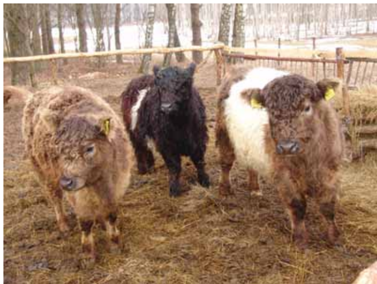
Sodybos aptvare galovėjai jaučiasi gerai