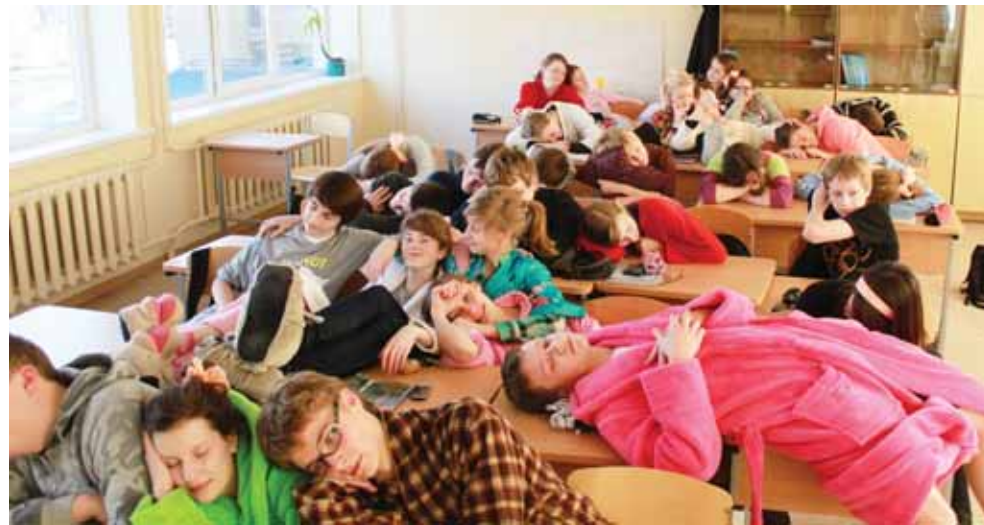
Mieganti “Ryto” gimnazijos 2c klasė