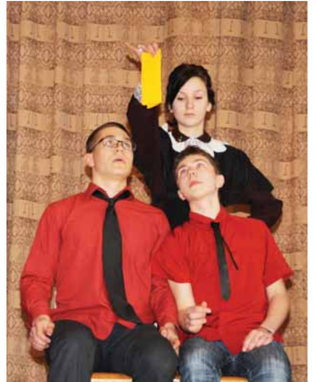
Spektaklio “Lygtis su dviem nežinomaisiais” herojai

Pastaruju metu suaktyvėjęs mokinių noras reikštis scenoje, dalyvauti renginiuose, tapti „žvaigždėmis“ ir po mokyklos stogu tikrai ženklus. Renginiai iš tiesų kokybiškesni, scenoje sudera judesys, žodžiai, muzika.