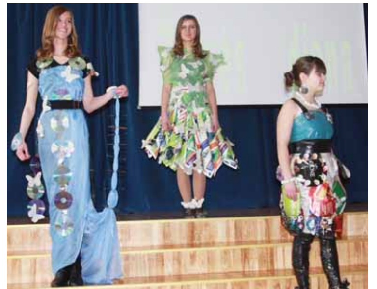
Renginio dalyvius nustebino kostiumai, aštuntokų sukurti panaudojant įvairias buitines atliekas