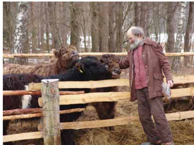
Dzūkijos pamiškės egzotiški gyventojai tik po dviejų savaičių prie šeimnininko priprato