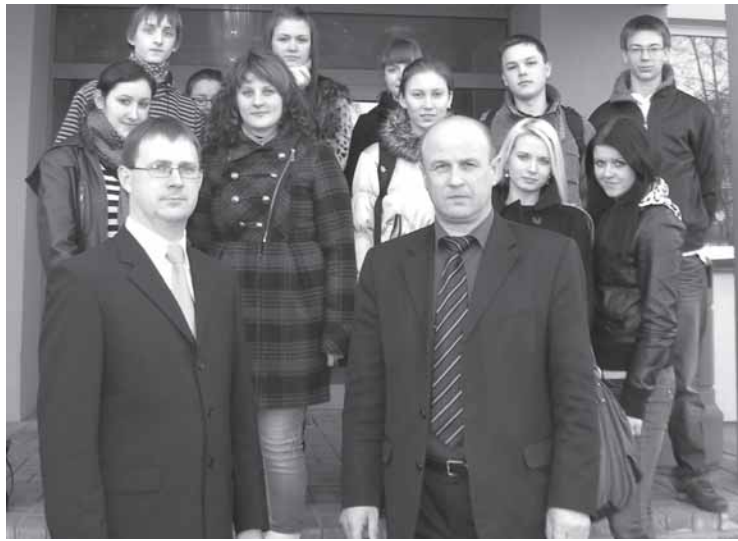
Paskaitai pasibaigus, visi kartu išiamžinome prie prokuratūros pastato ir vieni kitiems padėkojome už turiningai praleistą ketvirtadienio popietę