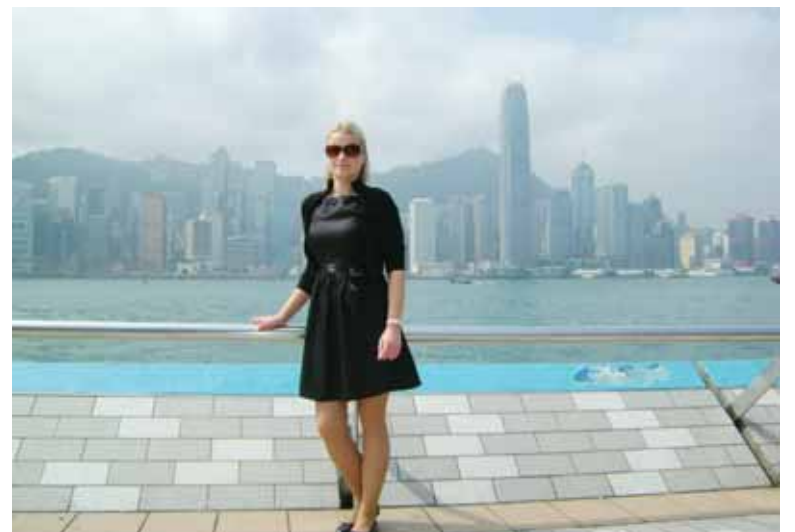
Šių metų vasarį Honkonge