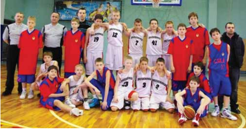
Druskininkų SC ir Maskvos „CASK“ klubo krepšininkai