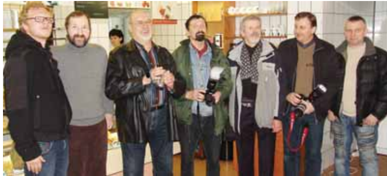
Druskininkų fotografų bendruomenės nariai

ėjusių metų rugpjūčio mėnesio, kuomet įsigalėjo ši tradicija. Pagal