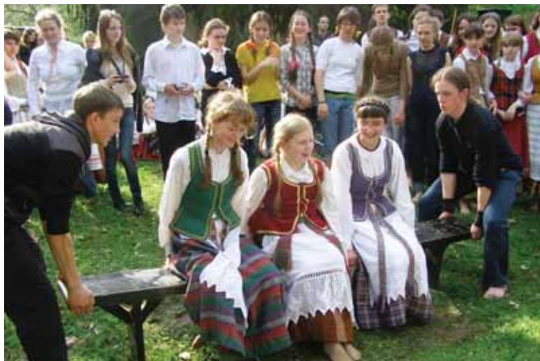
Bernai kilnoja po tris mergas