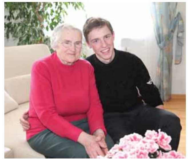
Su savo senele namuose Druskininkuose