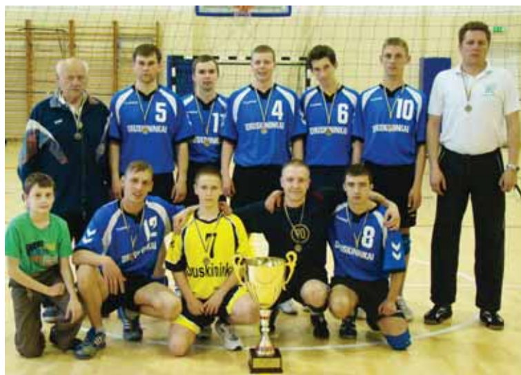
Romo Zautros tinklinio turnyro nugalėtoja - „Titano“ komanda