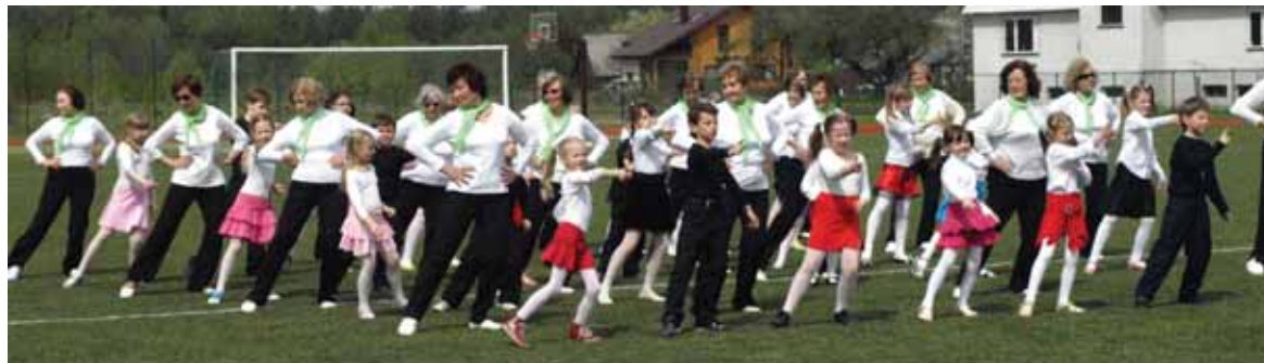
Dviejų kartų bendras šokis sveikatinimo renginio metu