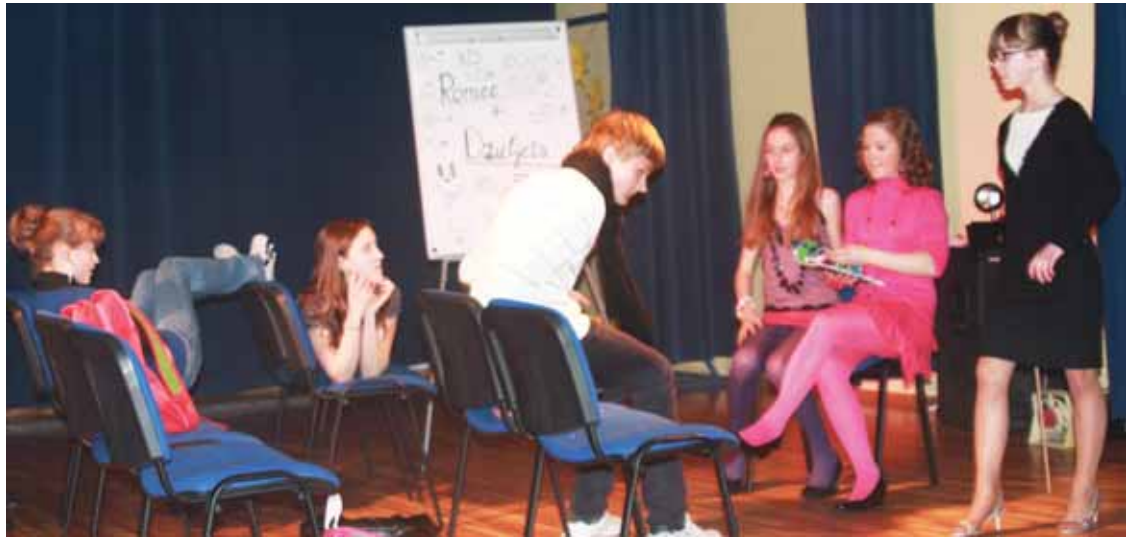
Iš "Saulės" pagrindinės mokyklos mokinių spektaklio „Meilė kitaip... arba Romeo ir Džiuljeta XXI amžiaus mokykloje“