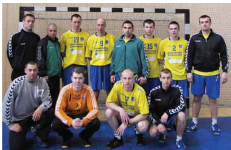
Druskininkų RK/SC vyrų rankinio komanda – Lietuvos vyrų rankinio čempionato vicečempionė

čius, Ž.Petrauskas, D.Norušis, V.Kalpokas, A.Bobinas. ● Kviečiame aktyviai dalyvauti Druskininkų kurorto šventės sporto renginiuose gegužės 29 d. (šeštadienį) 11 val. „Ryto“ gimnazijos sporto aikštyne (Klonio g.2): vaikinių gatvės krepšinio 3/3 varžybos (dalyvių registracija 10.30-10.50 val., komandos sudėtis 4 asmenys): 1996-1998 m.g. amžiaus grupėje; 1993-1995 m.g. amžiaus grupėje; 1992 m.g. ir vyresnių amžiaus grupėje; futbolo varžybos 5/5 (komandos sudėtis 8 sportininkai): 1994-1996 m.g. amžiaus grupėje; 1993 m.g. ir vyresnių grupėje; paplūdimio tinklinio 3/3 varžybos (komandos sudėtis 4 sportininkai): vaikinių ir merginų grupėse; šachmatų asmeninės varžybos: vaikinių ir merginų grupėse; rankinio berniukų varžybos: 1998 m.g. ir jaunesnių grupėje (komandos sudėtis 10 sportininkų); teniso dvejetų turnyras 10 val. (Turistų g. 3, teniso kortai).