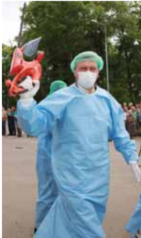
Druskininkų ligoninės gydytojai, nešini "opera- cinėmis priemonėmis"