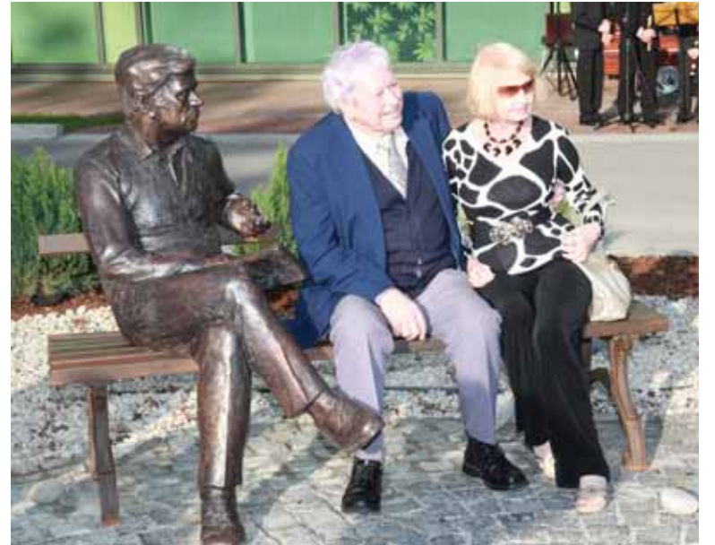
Į iškilmingą atidarymą D. Banionis atvyko kartu su žmona

„Jausmas - nepaprastas. Esu labai pagerbtas ir laimingas, - „Druskoniui“ pripažino aktorius D. Banionis. - Kaip čia kažkas juokaudamas sakė: „Druskininkai - tai Čiurlionis, Banionis ir Sabonis“. Druskininkus aš labai seniai pažįstu, dar nuo tų laikų, kai mes čia atvažiuodavome į gastroles, vaidindavom beveik kasmet, kai čia, kurorte, aplink buvo, taip saktant, tik bakūžės. Aš būdavau Druskininkuose nuolatinis sve-