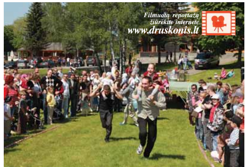
Varžybose dalyvavo ne tik vaikai, bet ir tėvai