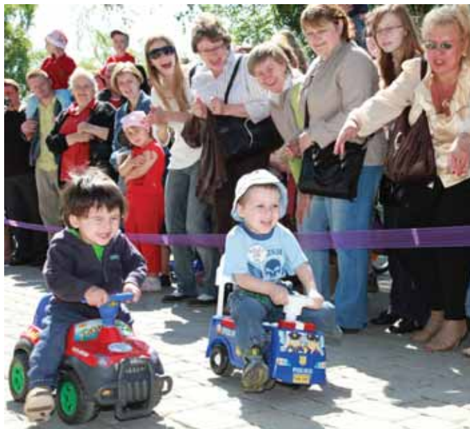
Kaip ir dera, daugiausiai emocijų liejosi mažojo ralio trasoje