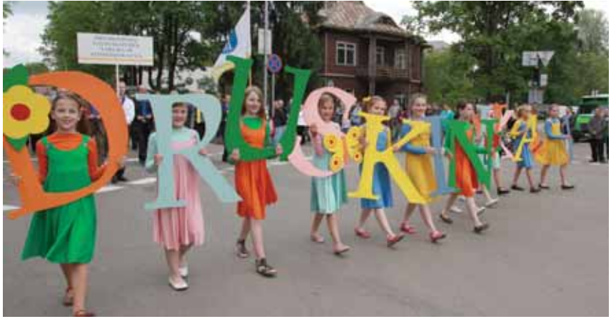
Kurorto šventė pradėjo visą vasarą truksiantį menų festivalį "Gera kurti kartu"

Filmuotą reportažą žiūrėkite internete www.druskonis.lt