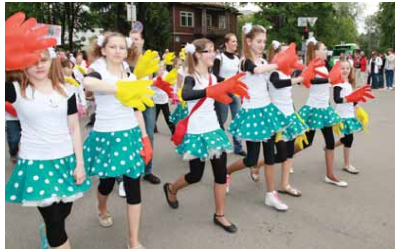
Sportinių šokių kolektyvo "Rock-rock" šokėjų kolona