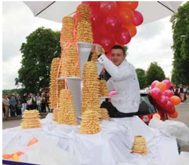
R.Pankevičienės konditerijos įmonės šakočių piramidė Pra- mogų aikštėje buvo išdalinta susirinkusiems