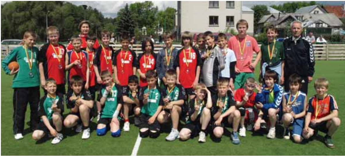
Druskininkų kurorto ir apskrities sporto švenčių rankinio varžybų prizininkai

● Birželio 4 d. 17 val. Druskininkuose, Laisvės aikštėje, bus iškilmingai atidarytas tradicinis tarptautinis žurnalistų ralis „Lietuva 2010“. 150 km ilgio trasoje, 18 greičio ir specialiųjų rungčių ruožuose išaiškės 4-ųjų atskirų – iki 1,6 l, iki 2,0 l, per 2 l ir dyzelinius variklius turinčių automobilių klasių nugalėtojai. Dauguma ralio etapų vyks Druskininkų gatvėse. Birželio 4 d. 18.30 val. Laisvės aikštėje įvyks lenktynės ralio globėjo Druskininkų mero R. Malinausko taurei laimėti. Kitą dieną, birželio 5 d. 14 val., prie Druskonio ežero bus surengtas ralio automobiliu tituluojamo „Toyota“ lenktynių etapas. Žiūrovai ir patys galės išbandyti „Toyotos“ naujausius hibridinius automobilius. Renginio generalinio rėmėjo „Continental“ taurės lenktynės vyks birželio 5 d. 17 val. Laisvės aikštėje. Pirmąkart rengiamas „Continental“ taurės stalo futbolo čempionatas, kur dėl vertingų „Continental“ prizų kausis žiūrovai. ● Birželio 5 d. 12 val. universaliame sporto aikštyne (Ateities g.13) vyks Alytaus apskrities futbolo pirmenybių I rato varžybos, kur