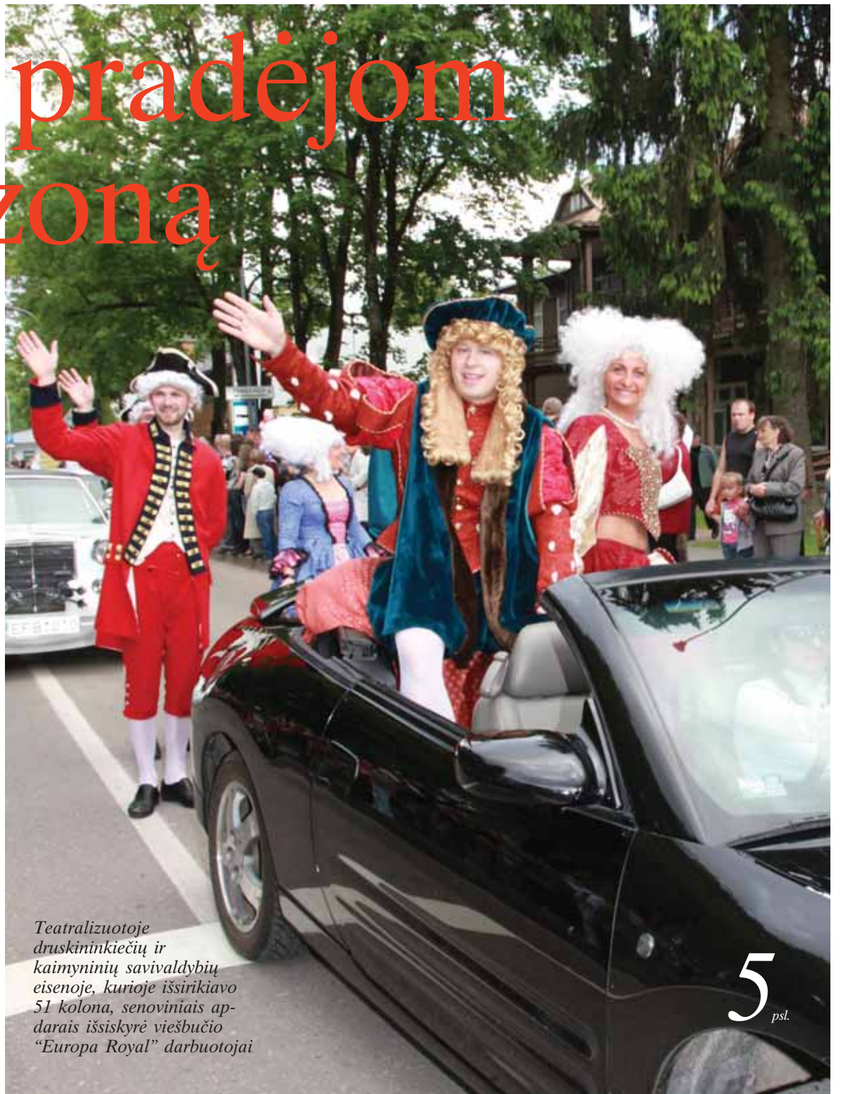
Teatralizuotoje druskininkiečių ir kaimyninių savivaldybių eisenoje, kurioje išsirikiavo 51 kolona, senoviniais apdarais išsiskyrė viešbučio "Europa Royal" darbuotojai