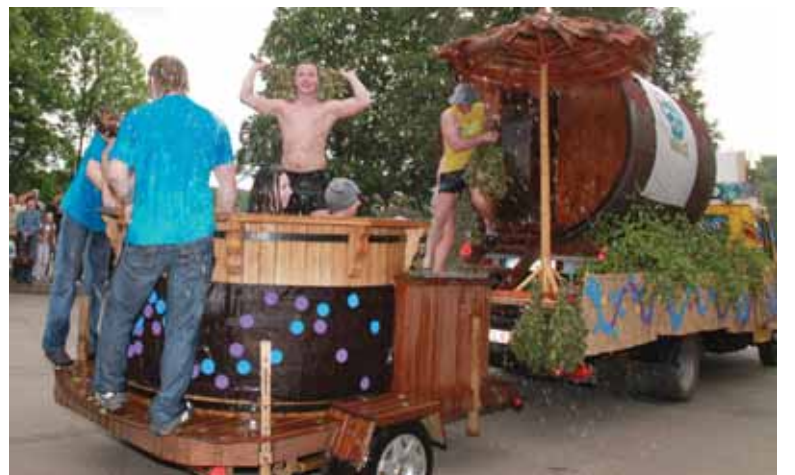
Vandens parkas savo pramogas perkelė į gatvę