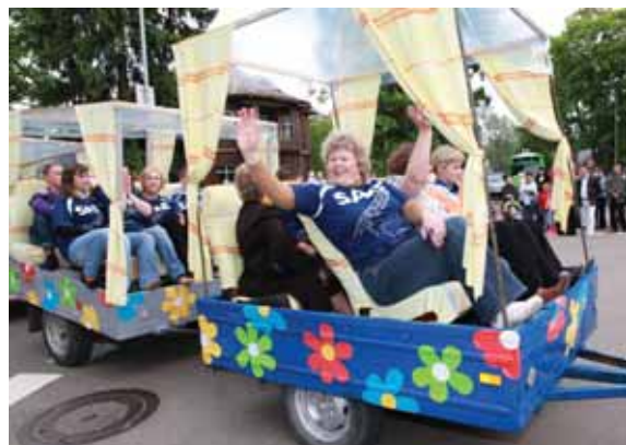
Amatų mokyklos dėstytojams nereikėjo pėdinti