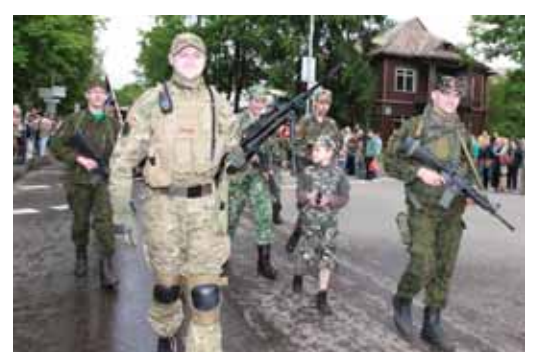
Ginkluota "Airsoft" bendruomenė