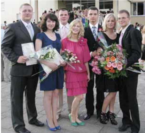
4 c klasės abiturientai