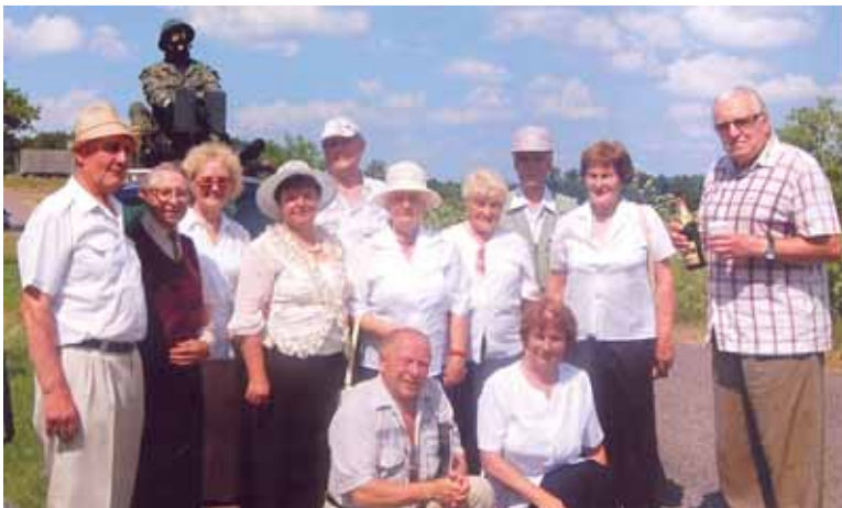
Garsi mūsų krašto Vaišnorų giminė paminklo atidarymo dieną