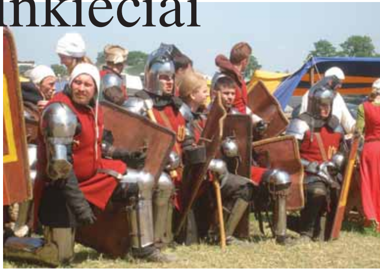
Kariai, vilkintys atkurtomis XIV a. Lietuvos didžiosios kunigaikštystės karių uniformomis

Strėlės lakstė ne tik Žalgirio mūšio lauke. Dvi valandos eilėje prie ledų ar alaus bokalo, pusvalandis prie tualetų, seniai išprekybininkų šaldytuvų išnykusios vaisvandenių atsargos, didžiuliai kamščiai beveik nereguliuoja-