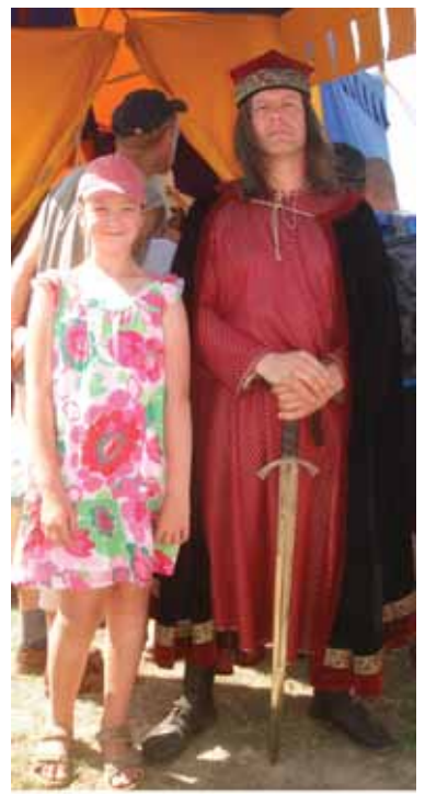
Onytė Ambrozaitė su Vytautu Didžiuoju

Filmuota reportažą žiūrėkite internete www.druskonis.lt