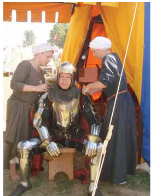
Vytautas Didysis ruošiasi mūšiu

muose keliuose – kritikos strėlės lėkė renginio organizatorių, nepasirūpinusių priimti šitokią minią žmonių, pusėn.