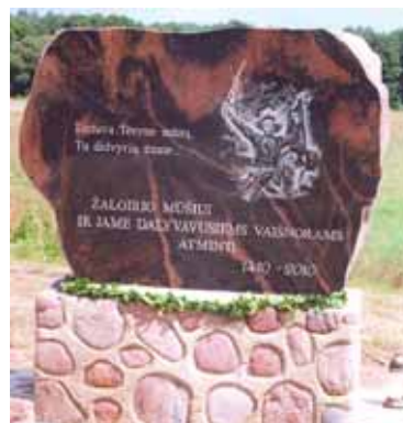
Paminklas Žalgirio mūšiu ir jame dalyvavusiems Vaišnorams atminti Lipliūnuose

čiausio kauburėlio, pašventintas kuklus, bet didingas paminklas. Jis primena 600 metų senumo įvykius, kuomet Lietuvos Didžiosios kunigaikštystės pulkai 1410 metų birželio 3-ąją pajudėjo iš Vilniaus, Rūdininkų ir Gudų giriose prisimedžioję žverienos, pasiėmę po 5 kepalus duonos, po saiką rugių ir