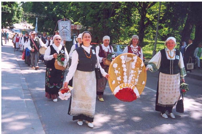
Be "Bočių" draugijos "Kraitės" etnoklubo neapsieina nė vienas svarbus Druskininkų renginys