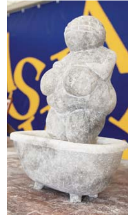
Apkūni nuogalė gydyklų voniose