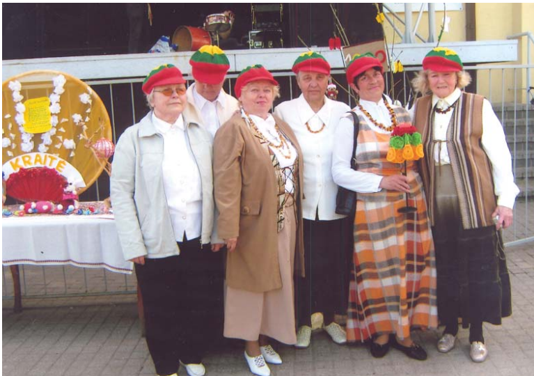
Išradingosios "Bočių" etnoklubo "Kraitė" moterys