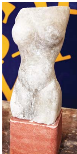
Apie moters kūną vyras svajoja ir skobdami druską