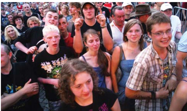
Druskininkiečiai šėlo festivalio koncertuose

Jau tradiciniu tapęs bliuzo festivalis Lenkijos mieste Suvalkuose šiemet buvo organizuojamas trečiąjį kartą. Jis vyko tris savaitgalio dienas – nuo liepos 16 iki 18-osios. Kaip ir kasmet, į Suvalkus pasiklausyti geros muzikos išvyko didelis būrys Druskininkų jaunimo.