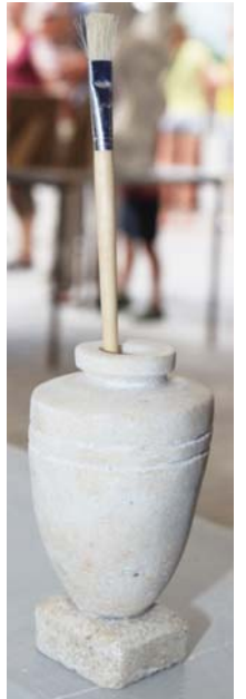
Darbai iš druskos - tikras menas