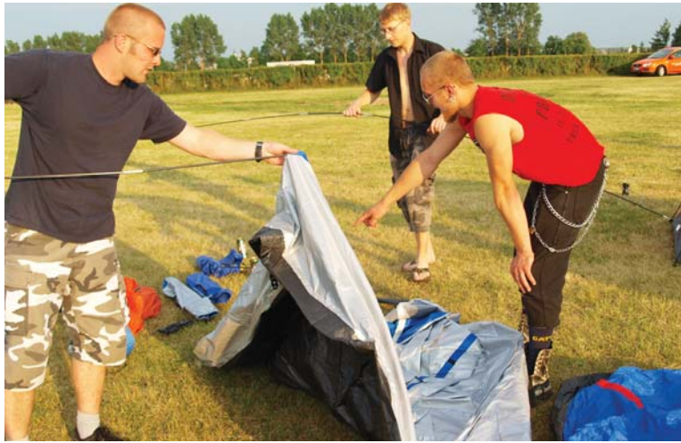
Jaunimas kempinge įsikūrė dieną prieš nelaimę - penktadienį