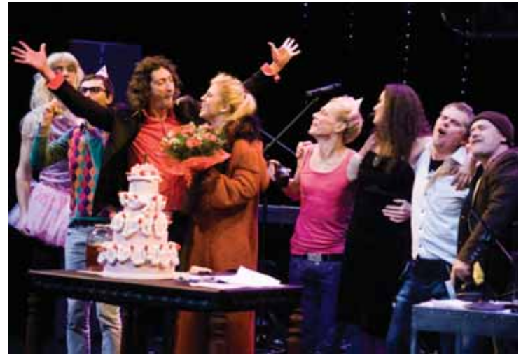
Komedija „Radijo ereliai“ pristatoma kaip „Striptizo erelių“ tęsinys