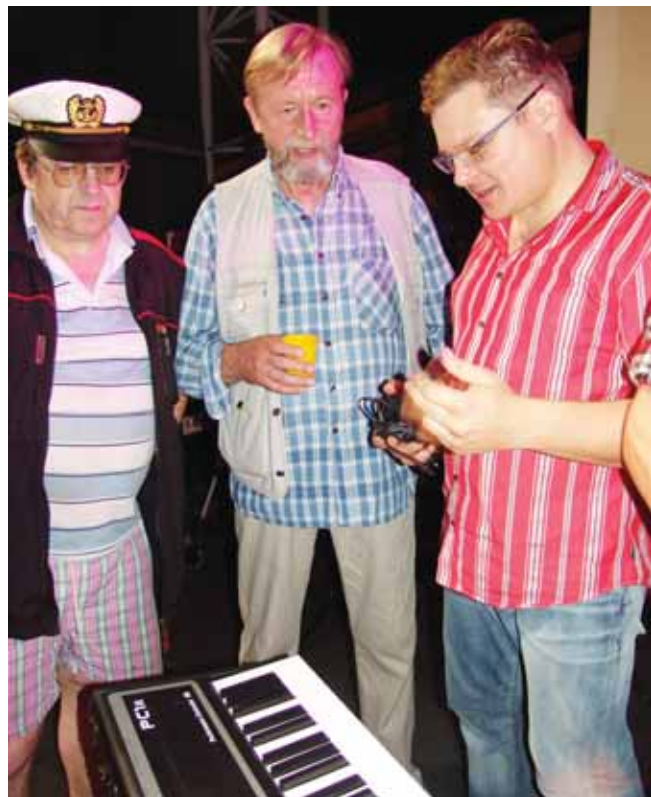
Po koncerto draugams dar ilgai nesinorėjo skirstytis