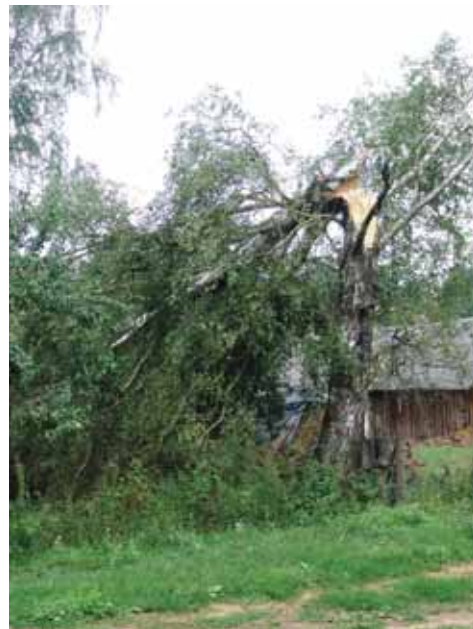
Švendubrėje škvalas laužė šimtamečius medžius, sukeldamas žmonėms baimės