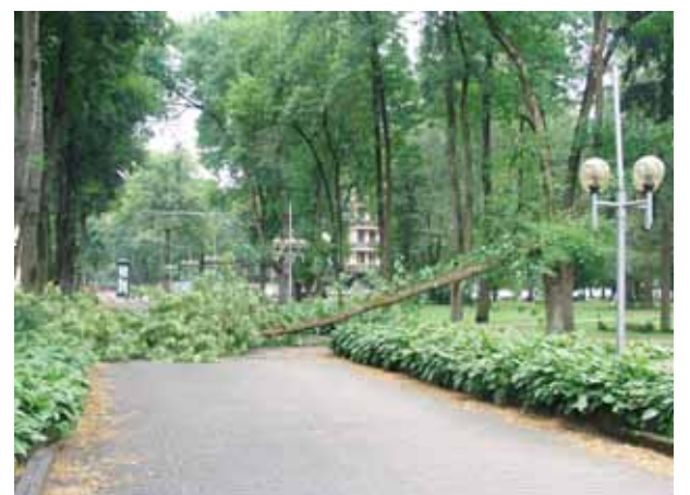
Lūžena visiškai užtvėrė Vilniaus alėją