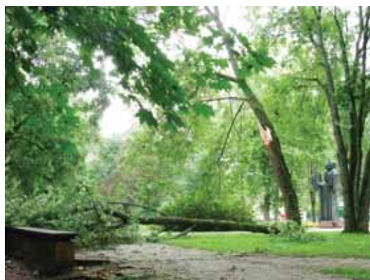
"Druskonio" inf. Virto medžiai šalia M.K.Čiurlionio paminklo