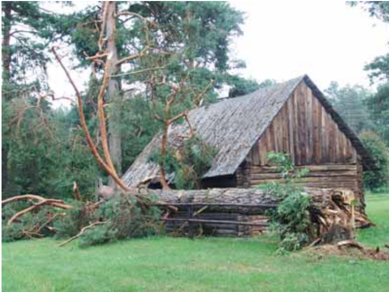
Nulaužta galinga pušis vos nesugriovė ūkinio pastato Švendubrėje