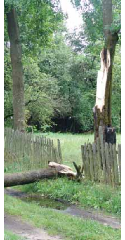
Švendubrėje škvalas vertė tvoras, užtvėrė kelius, griovė pastatus