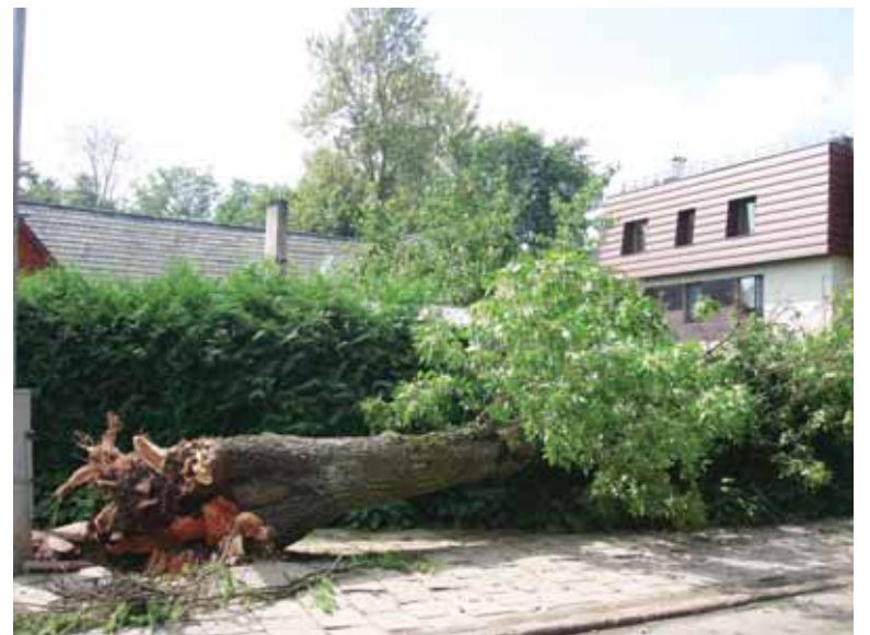
Išrautas su šaknimis medis nugriovė dalį sandėliuko Druskininkų gatvėje