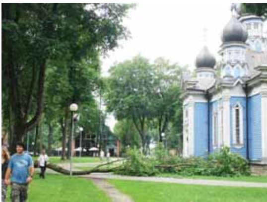
Išvarta Druskininkų cerkvės papėdėje