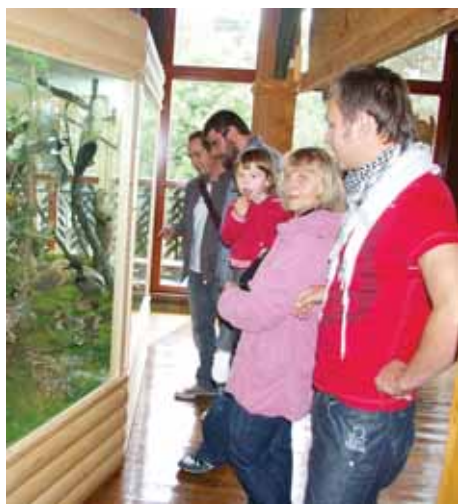
Svečiai iš Ispanijos susipažįsta su naująja ekspozicija