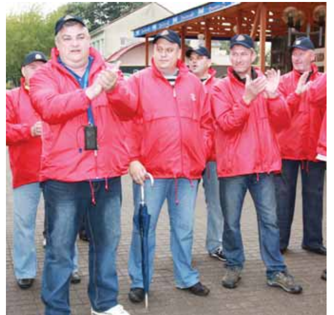
Virvės traukimo rungtyje mūsų šeimoms lygių nebuvo