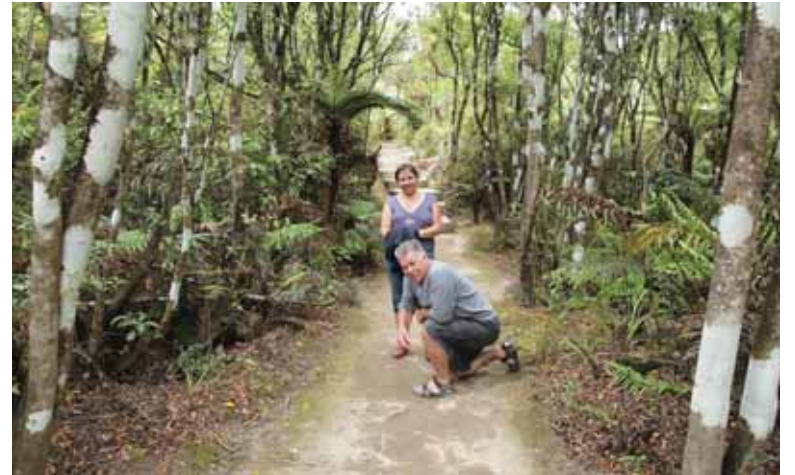
Naujojoje Zelandijoje Kišonai išmairė ir džiungles

„Naujoji Zelandija, turinti vos 4 milijonus gyventojų, – labai civilizotas kraštas. Mano šalis buvo pirmoji pasaulyje, kurioje moterims buvo suteikta rinkimų teisė. Čia visi lygūs, nepriklausomai nuo lyties, odos spalvos ar tautybės. Ir moterims čia gyventi labai gerai – Naujojoje Zelandijoje vyrai namuose gamina valgi ir plau-