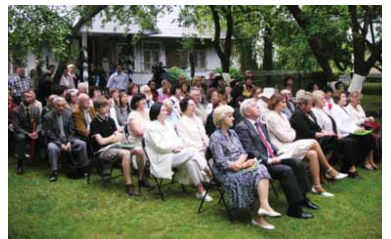
Festivalio renginiai sulaukdavo didelio žiūrovų dėmesio