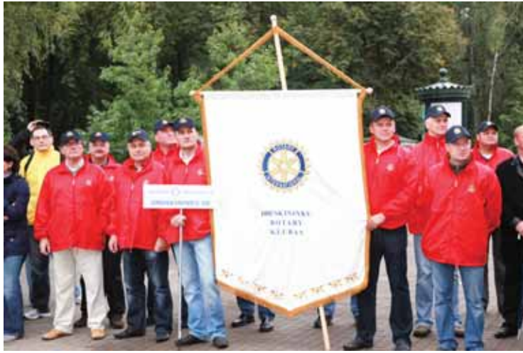
Druskininkų Rotary klubo nariai

Sekmadienio rytą rotariečiams buvo organizuotos grybavimo varžybos, iš lovų ištvėrusios aštuonis dalyvius. Šįkart grybai rinkti itin specifinėje vietoje –