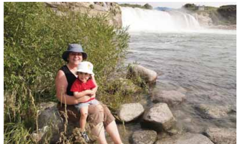
Geriausias poilsis močiutei - su anūkeliu gamtoje