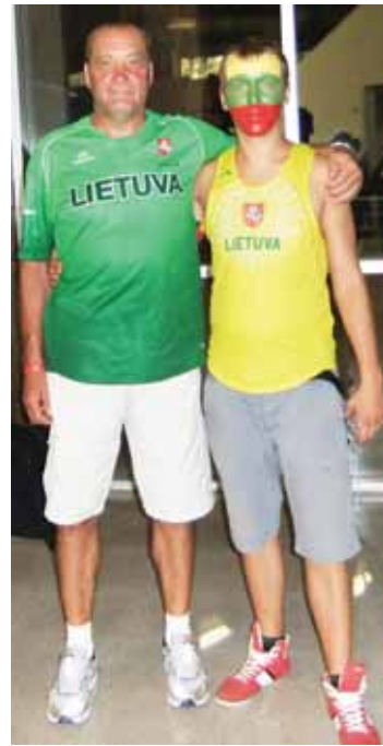
Turkijos vėliavos fone