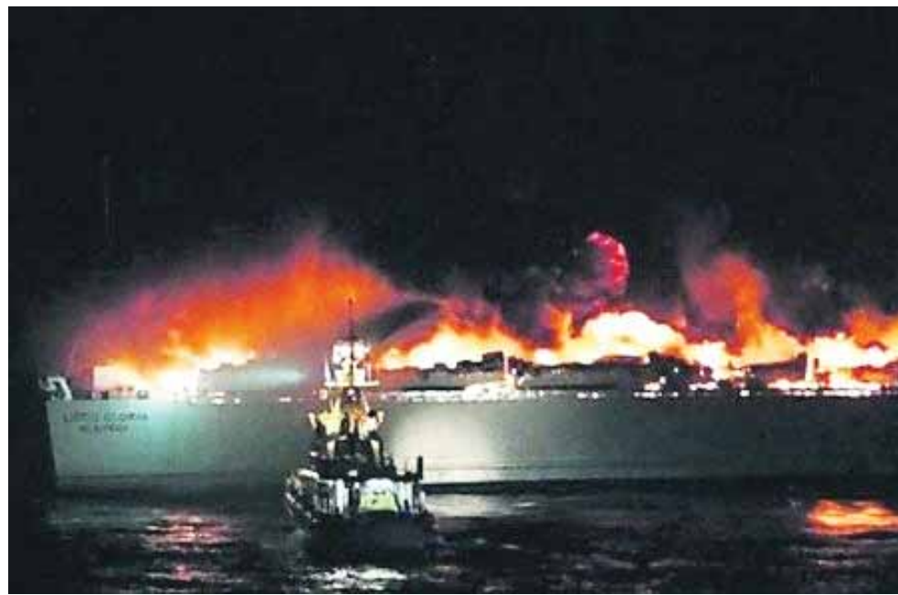
Gaisrą degančiame kelte „Lisco Gloria“ pavyko užgesinti per 30 valandų