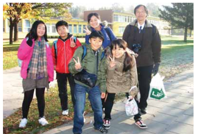
„Atgimimo“ vid. mokykla sulaukė svečių iš tolimosios Japonijos