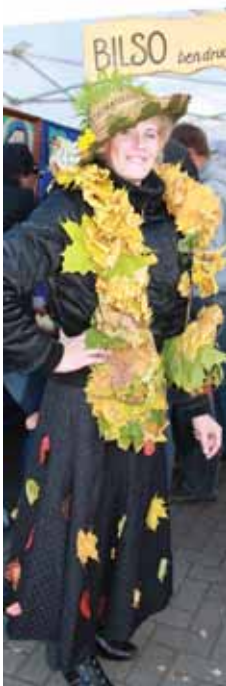
Bilso bendruomenės moterys moka pasipuošti ir iš lapų