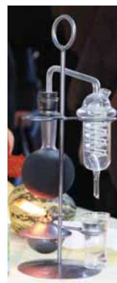
„Liepė atsinešti ką nors naujo, tai ir atsinešėme“, - vaišindami „velnio“ lašais, juokavo vyrai, į šventę atsinešę nedidelį dzūkiškos naminukės aparatą