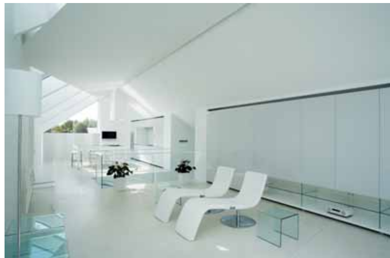
Vilos viduje - baldų ir daiktų minimalus kiekis