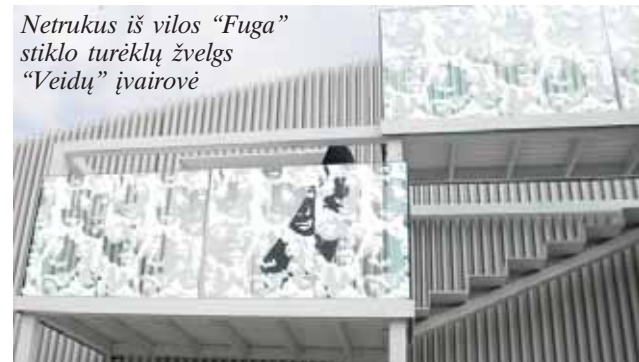
Netrukus iš vilos "Fuga" stiklo turėklų žvelgs "Veidų" įvairovė