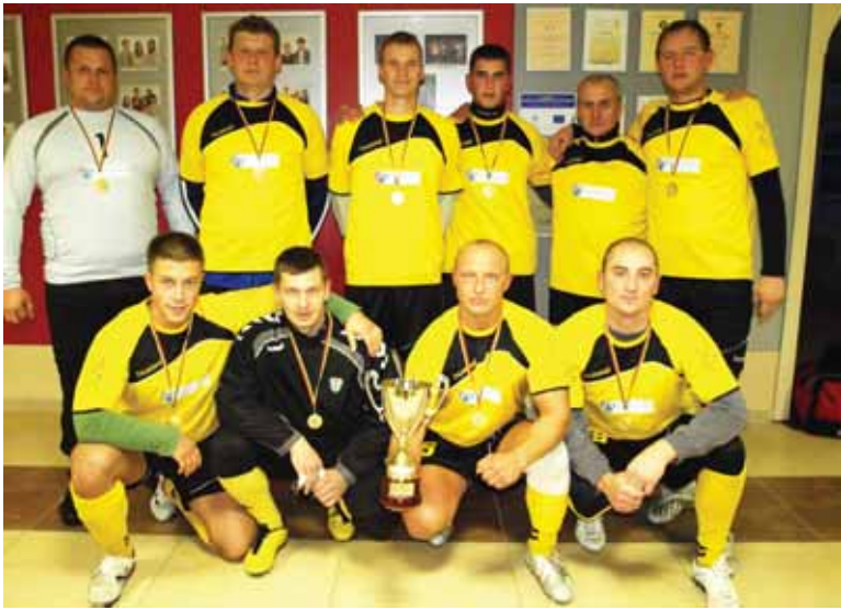
„Aquadarko“ futbolo komanda, J. Karoso turnyro nugalėtoja