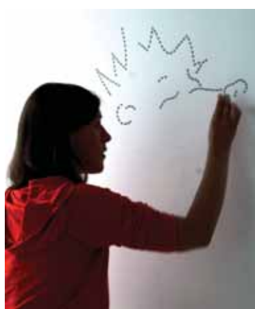
Žinoma grafikė Eglė Kuckaitė darbo įkarštyje baltojoje viloje kuriant freską "Mikalojaus drugiai"