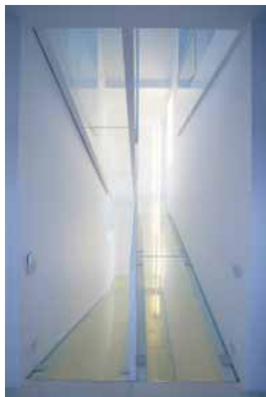
Laiptai be pakopų