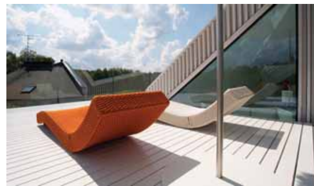
Ant šlaitinio stogo galima atsipalaiduoti

rkelta iš M.K.Čiurlionio pieštinių fantazijų bei papildyta ežiuko atvaizdu. Kaip žinia, Japonijoje ir Kinijoje ežys garbinamas kaip tur-