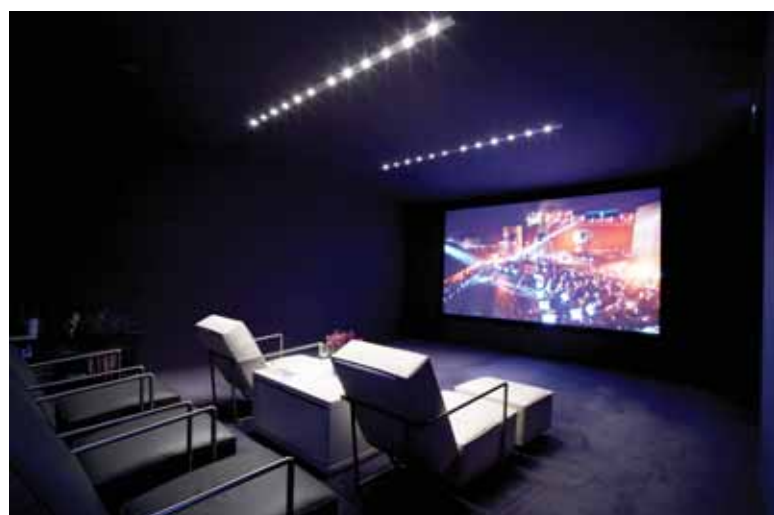
Šalia baseino įrengta kino salė, kur galima stebėti pakankamai solidaus formato filmus

to simbolis, o Centrinėje Azijoje ir kai kur Afrikoje šis gyvūnas laikomas saulės sutvėrimu bei siejamas su ugnimi ir civilizacija. "Ma-