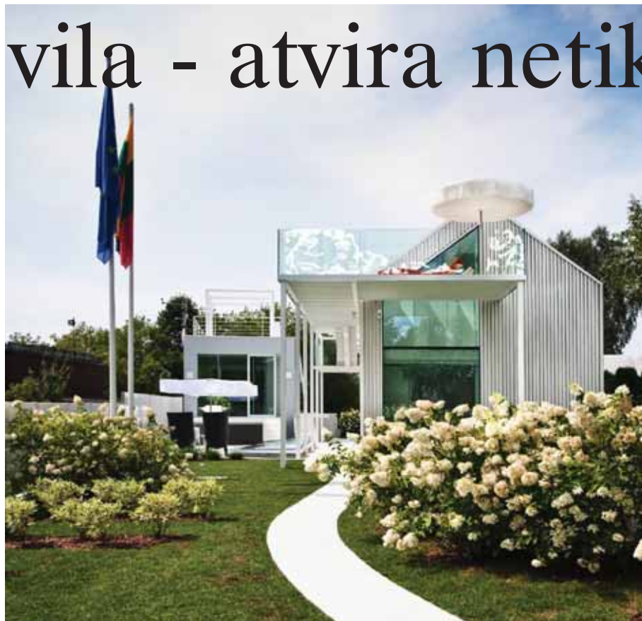
Baltosios vilos vidaus kiemas