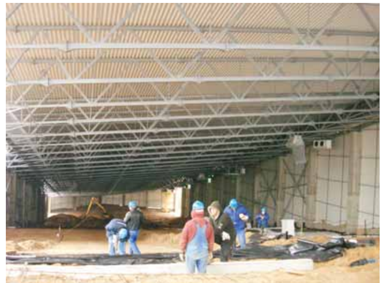
Pagrindinė trasa šiandien primena bityną: statybininkai čia darbuojasi nuo ryto iki vakaro