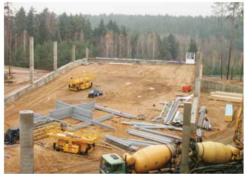
Būsimoje pradedančiųjų slidininkų trasoje kol kas plūša statybos technika